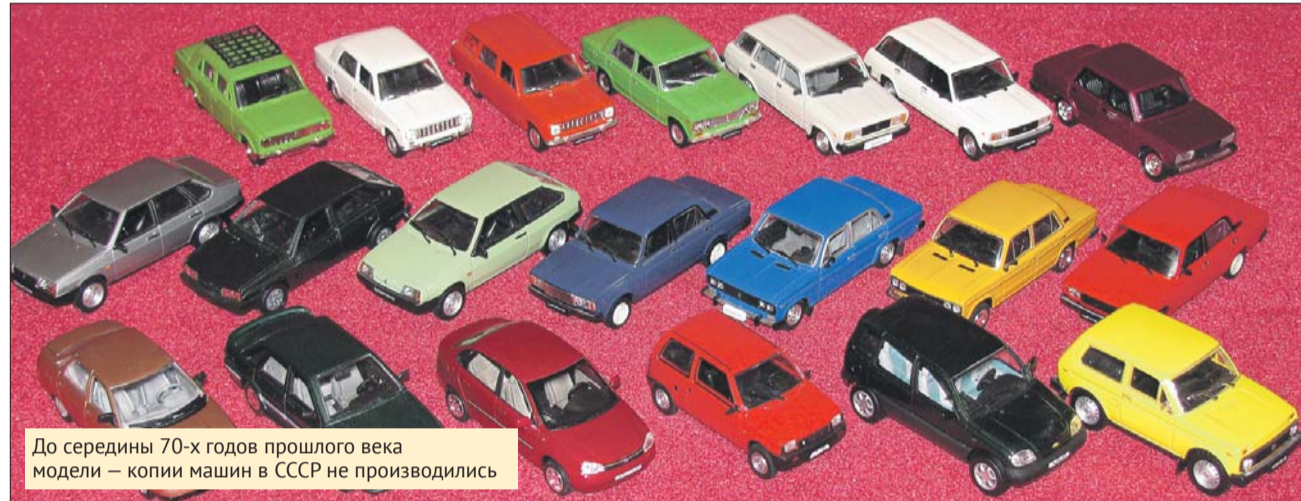
До середины 70-х годов прошлого века модели — копии машин в СССР не производились

Хобби быстро завоевало весь мир и стало одним из самых популярных видов коллекционирования. Кроме... СССР.