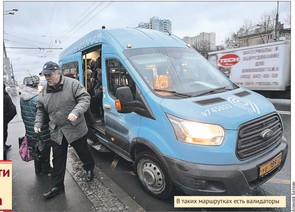
В таких маршрутках есть валидаторы