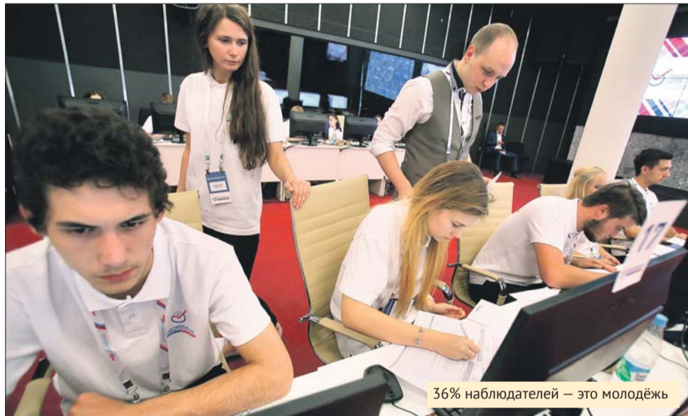
36% наблюдателей — это молодёжь

— Сразу развенчаю миф об искусственно раздутом количестве заявлений о прикреплении. Иногородных избирателей в Москве закрепилось на избирательных участках 2,6%