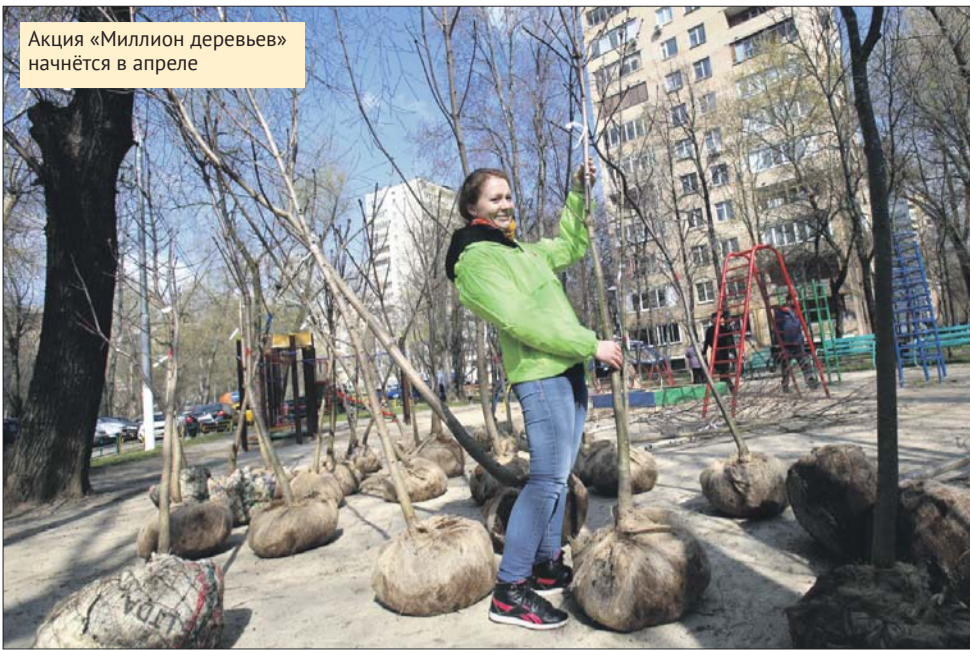
Акция «Миллион деревьев» начнётся в апреле