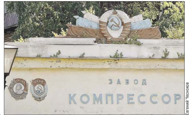
Проходная завода «Компрессор»