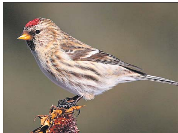
Чечётка издаёт ритмичные трели или посвистывание