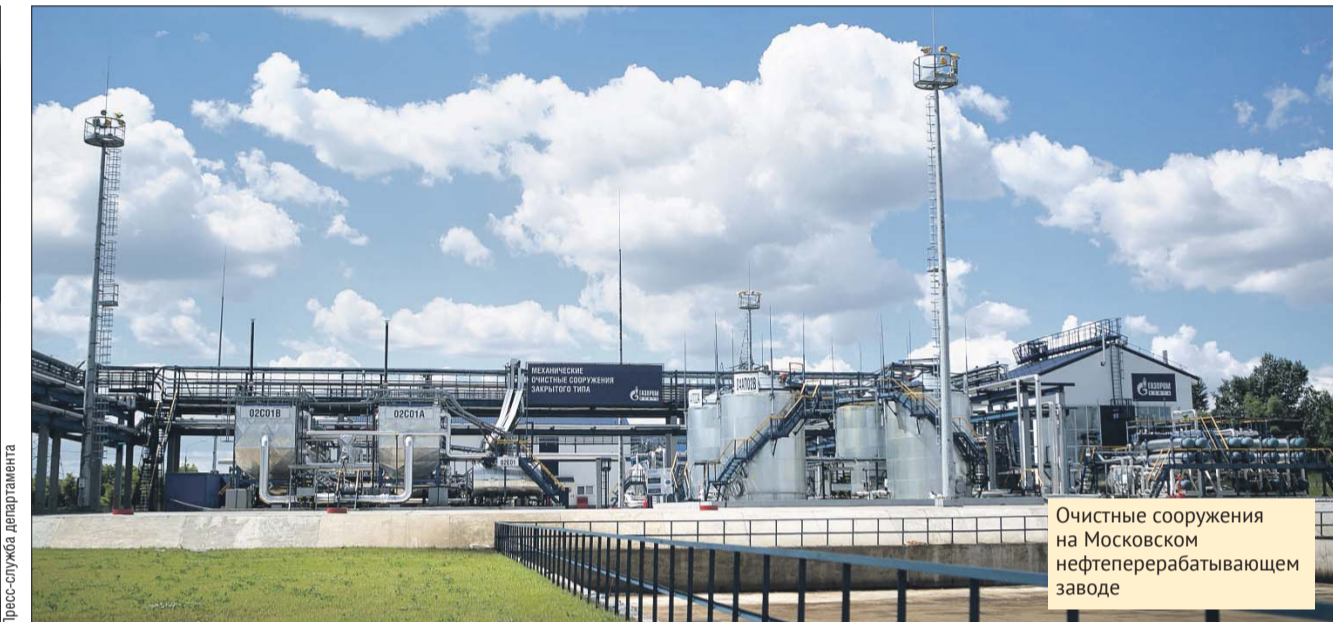
Очистные сооружения на Московском нефтеперерабатывающем заводе