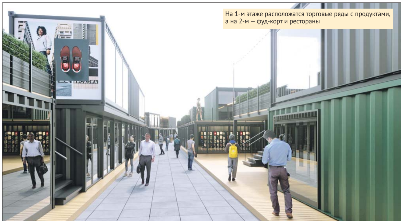
На 1-м этаже расположатся торговые ряды с продуктами, а на 2-м — фуд-корт и рестораны