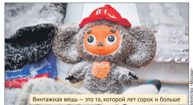
Винтажная вещь — это та, которой лет сорок и больше