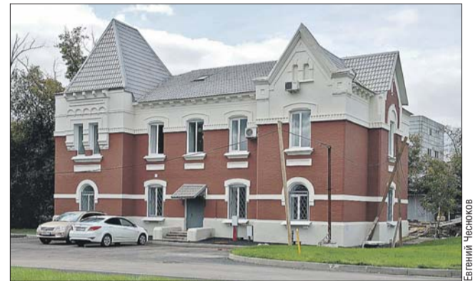
Жилой дом 3-го типа, где селили станционных служащих

типа, в котором располагались квартиры станционных служащих: начальника станции и его