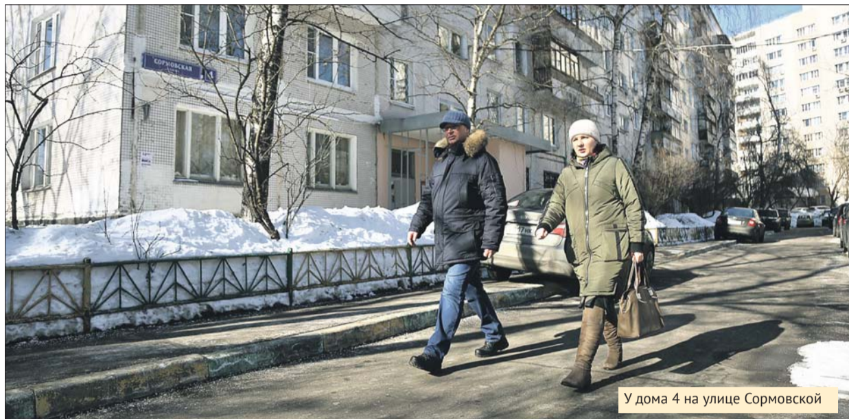
У дома 4 на улице Сормовской