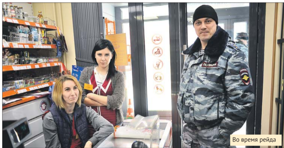
Во время рейда

Помощник прокурора рассказывает, что нелегальные работники и не на такое способны. Чтобы избежать ответственности, они перелезают через двухметровые заборы, перепрыгивают через широкие траншеи. Сегодня силовую поддержку оказывает отдельная рота ППС. Бойцы роты сопровождают 12 задержанных нарушителей до автобуса с решётками на окнах, а затем отвозят в отделение полиции.