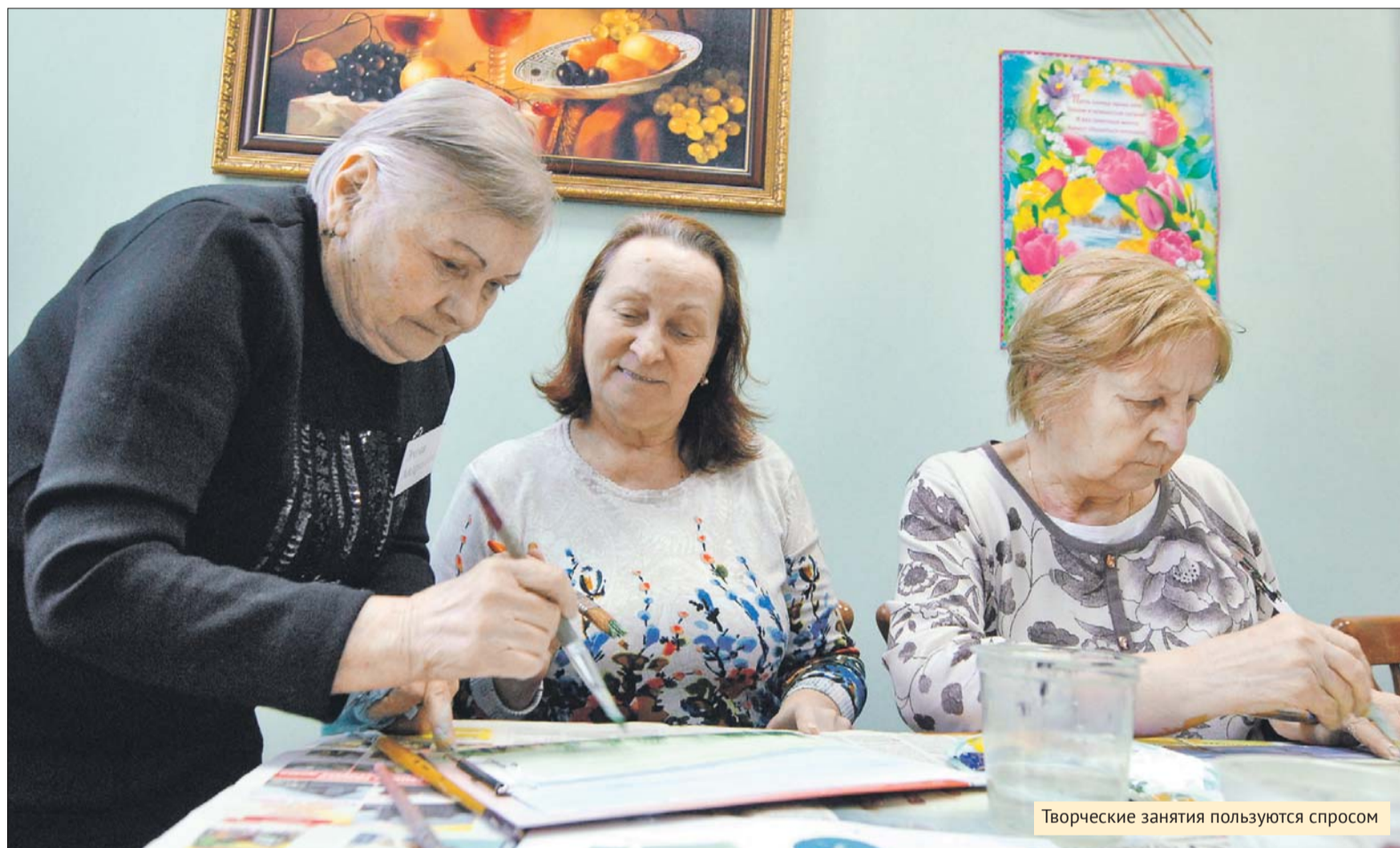
Творческие занятия пользуются спросом

— Больше всего пользуется спросом творчество: вязание, макраме, бисероплетение, декупаж. На втором месте танцы — спортивные, бальные, вос-