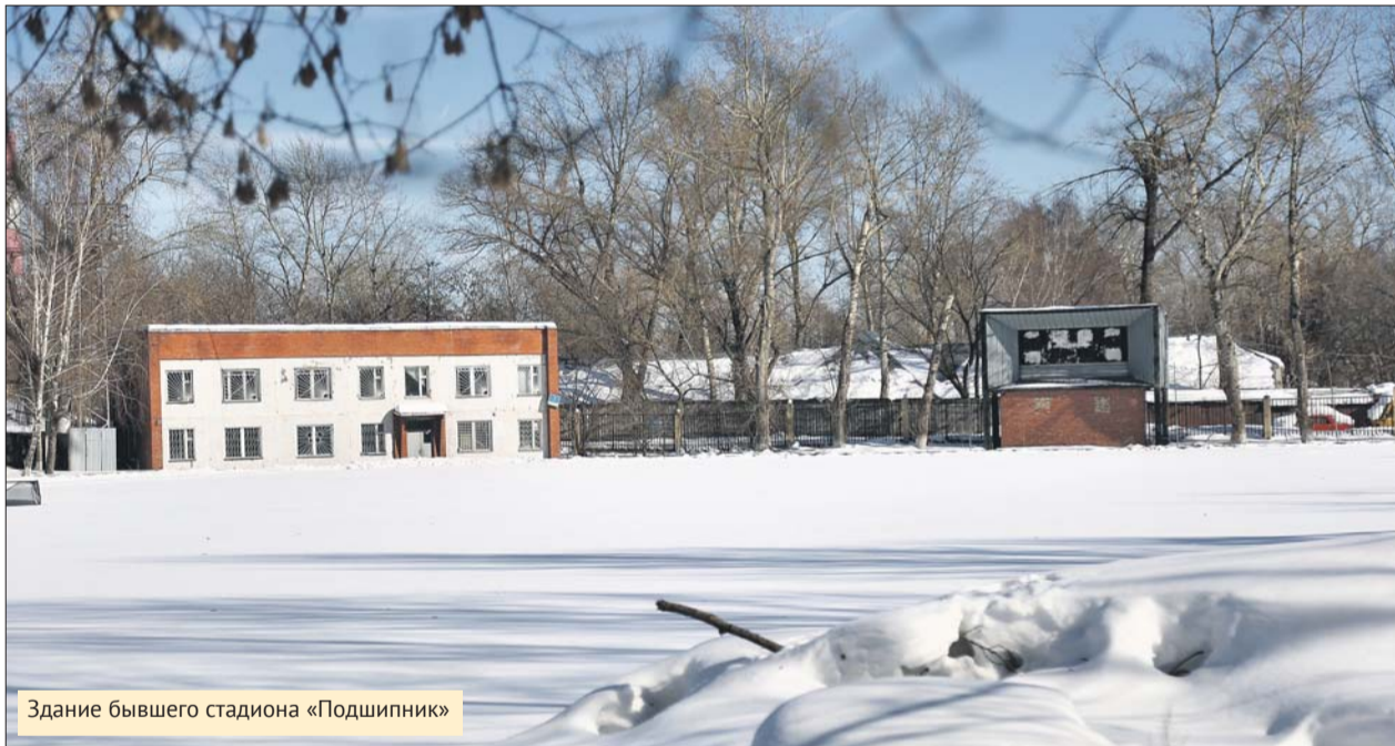
Здание бывшего стадиона «Подшипник»