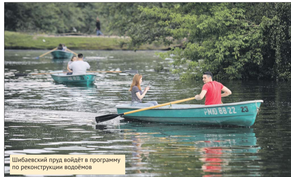
Шибавский пруд войдёт в программу по реконструкции водоёмов

— В прудах ЮВАО Роспотребнадзор не разрешает