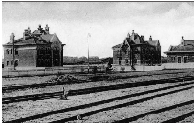
Станция Андроновка. 1907 год

Для служащих МОЖД строили жилые дома нескольких типов. На Андроновском шоссе сохранился жилой дом 3-го