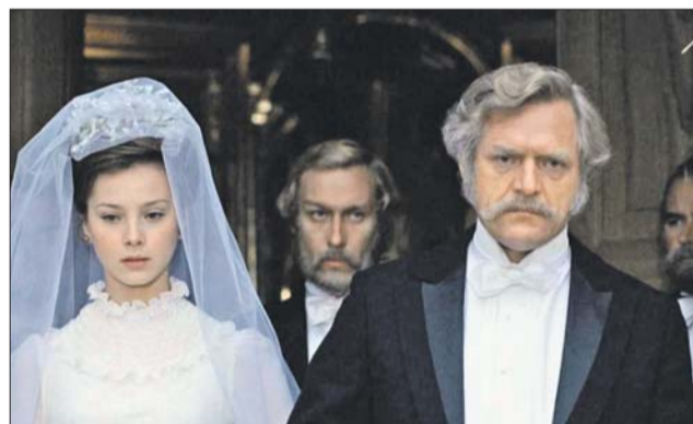
В кинодраме «Мой ласковый и нежный зверь». 1978 год