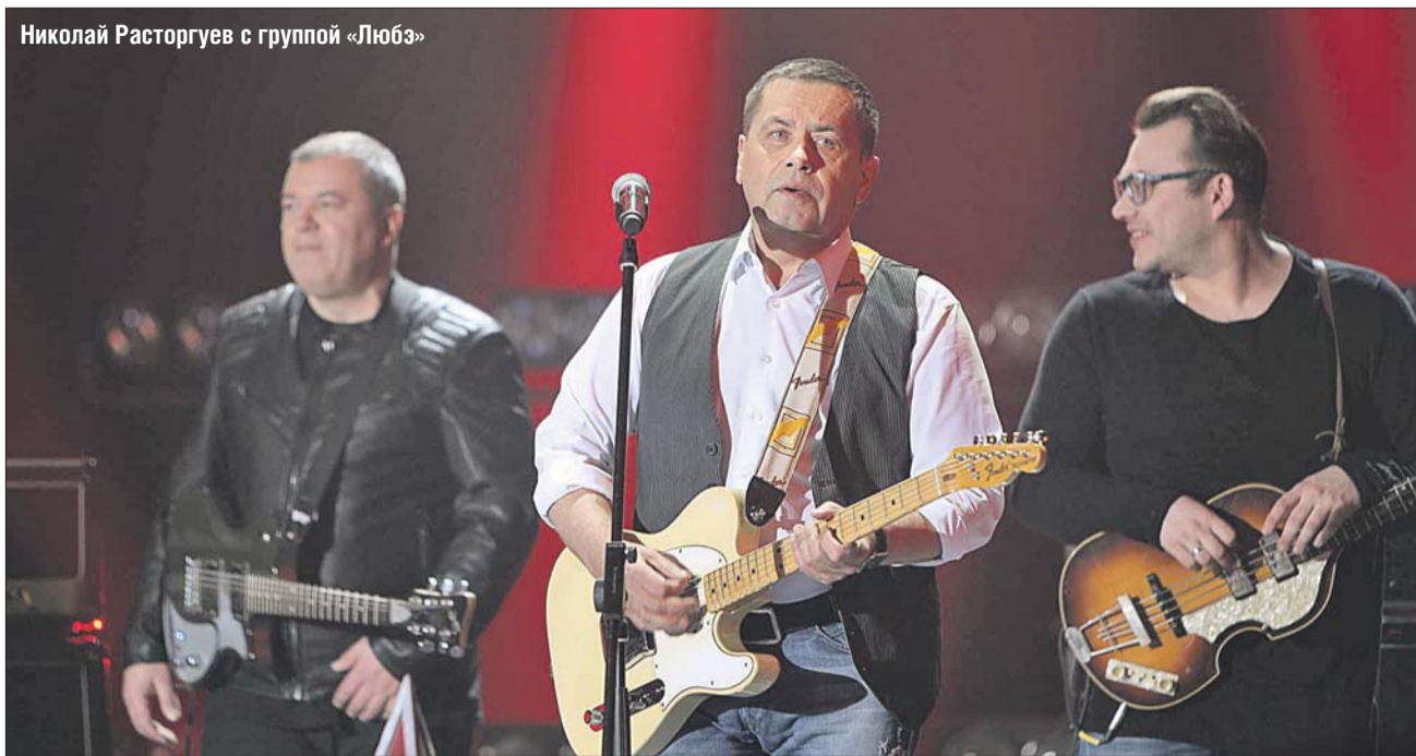
Николай Расторгуев с группой «Любэ»

ской Армии, от него несло нафталином. И мы пели песни группы «Битлз».