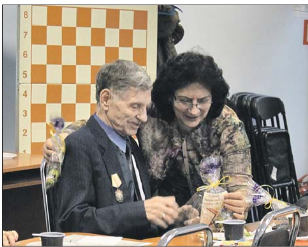
Вручение подарков к 23 Февраля

Заседания клуба проходят ежемесячно, их участником может стать любой желающий. Адрес КЦ «Лидер»: Лермонтовский просп., 2, корп. 2, тел. (495) 700-9546.