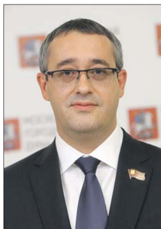
Председатель МГД Алексей Шапошников надеется, что это станет доброй традицией

сийской Федерации молодым москвичам в стенах Московской городской думы. Хотелось бы, чтобы это стало доброй традицией. Получить паспорт в парламенте российской столицы — знаковое событие для любого молодого человека. Поздравляю всех с этим знаменательным днём, пусть он останется ярким воспоминанием на всю вашу долгую и успешную жизнь!