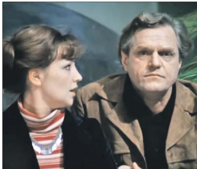
В фильме «Гараж». 1979 год

— Марков обладал высшей способностью артиста — умением играть молчание, держать паузу, — рассказывает Соловьёва. — В знаменитом спектакле Виктюка «Царская охота» актёр две минуты в тишине снимал кольцо с пальца. И всё это время