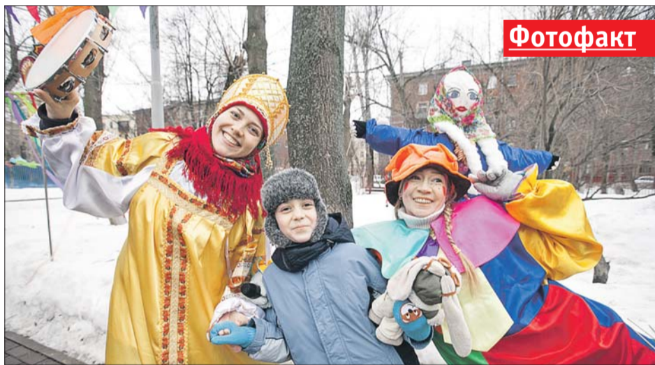
Праздничные гулянья на Люблинской улице