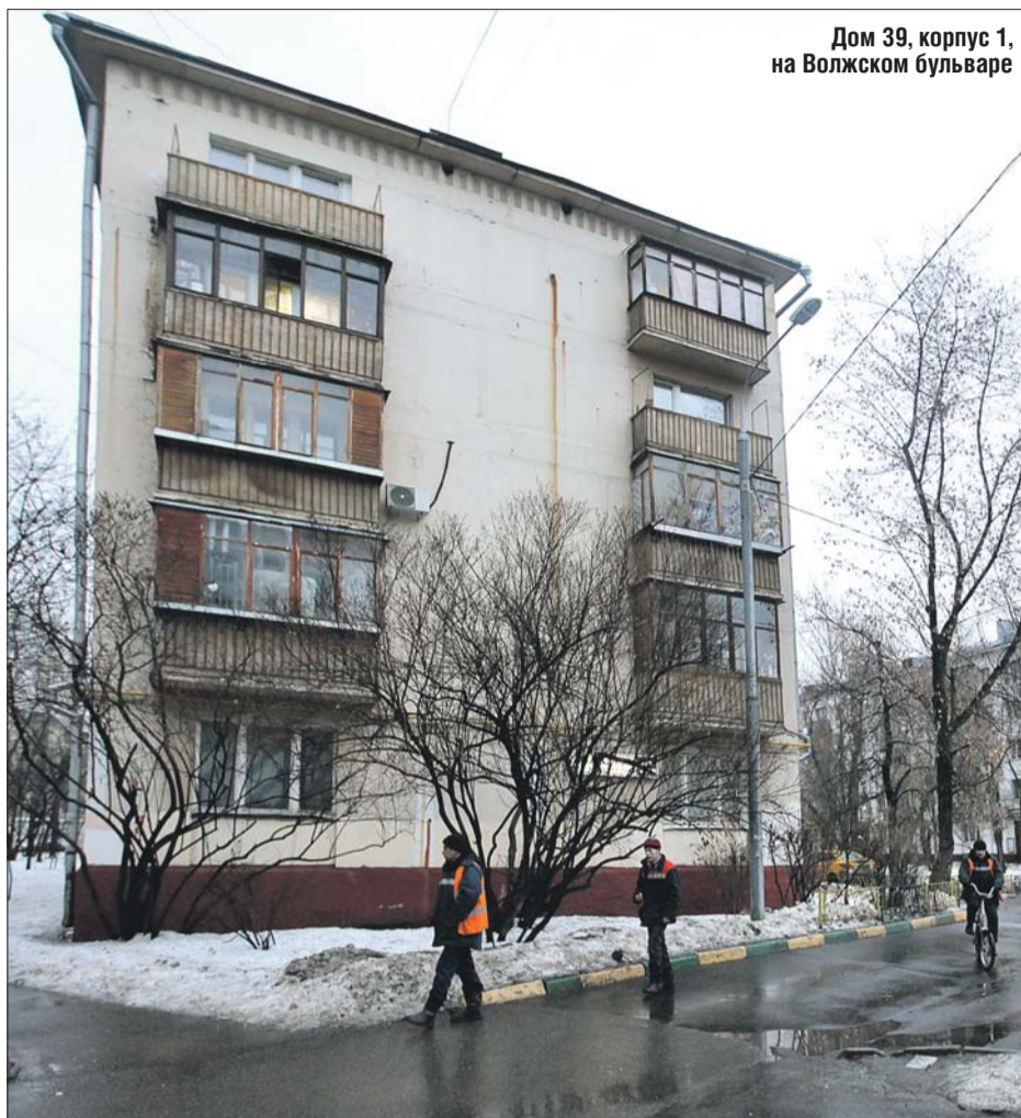
Дом 39, корпус 1, на Волжском бульваре

Проверка подвала на Волжском бул., 39, корп. 1, длилась около часа. Кошек не обнаружено. К тому же с задней стороны дома имеется открытый — без решётки — продох, который никто не закрывал. Его размер — примерно 25 на 25 сантиметров, что вполне достаточно для свободного прохода кошек. В то же время большие оконные проёмы подвала этого дома действительно закрыты металлическими сетками: таковы требования правил и норм технической эксплуатации жилищного