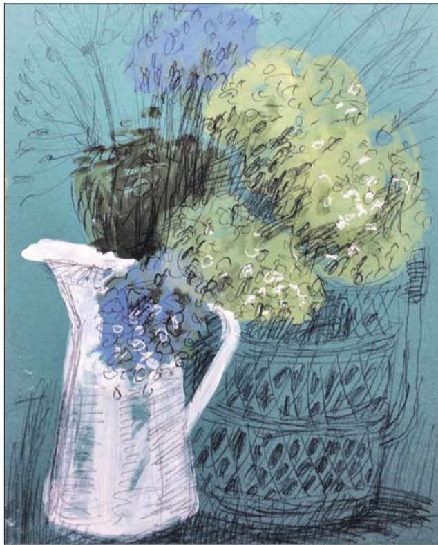
«Белый кувшин» Елены Тарутиной — одна из работ проекта «100 дней рисования»