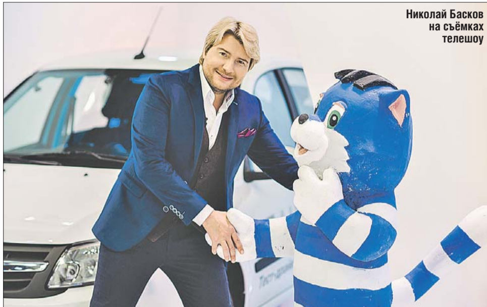
Николай Басков на съёмках телешоу