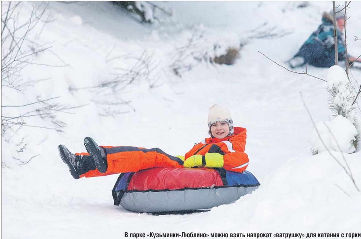
В парке «Кузьминки-Люблино» можно взять напрокат «ватрушку» для катания с горки

Любители зимних видов спорта могут показаться на коньках в парке им. Артёма Боровика (у метро «Братиславская»). Там есть каток с искусственным льдом. С 11.00 до 15.00 кататься можно бесплатно. Работают прокат коньков и тёплая раздевалка. А 22 февраля пройдёт традиционный турнир по стрит-хоккею