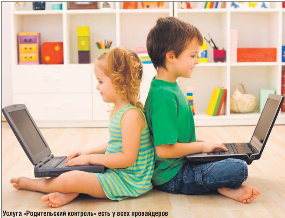
Услуга «Родительский контроль» есть у всех провайдеров

Благодаря этому фильтру получить доступ к любым запрещённым материалам, по словам дирек-