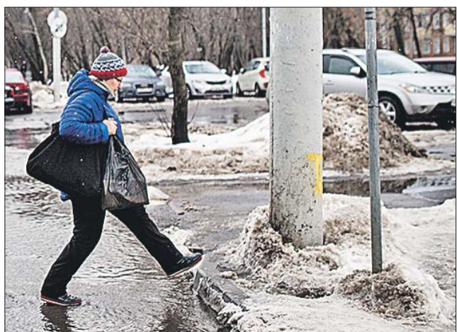
В оттепель врачи советуют измерять давление и снизить физические нагрузки

Минувший год для Москвы стал самым тёплым за всю историю наблюдений.