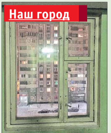
Из окна подъезда на улице Генерала Кузнецова, 13, корпус 2, сильно дуло