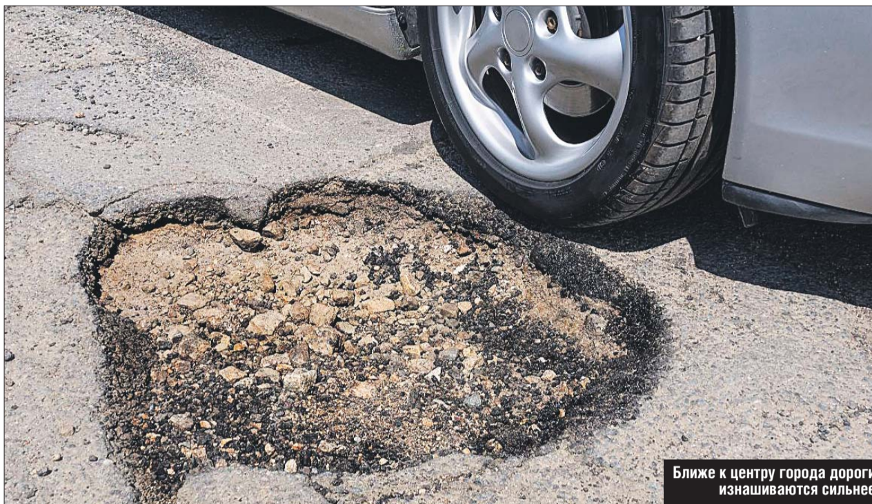
Ближе к центру города дороги изнашиваются сильнее