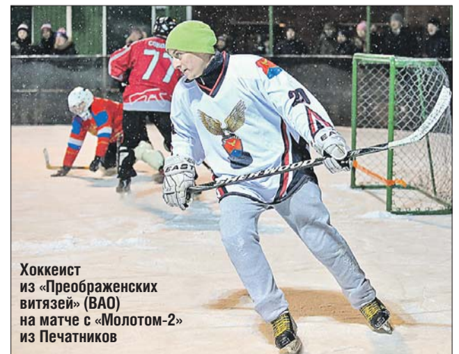
Хоккеист из «Преображенских витязей» (ВАО) на матче с «Молотом-2» из Печатников