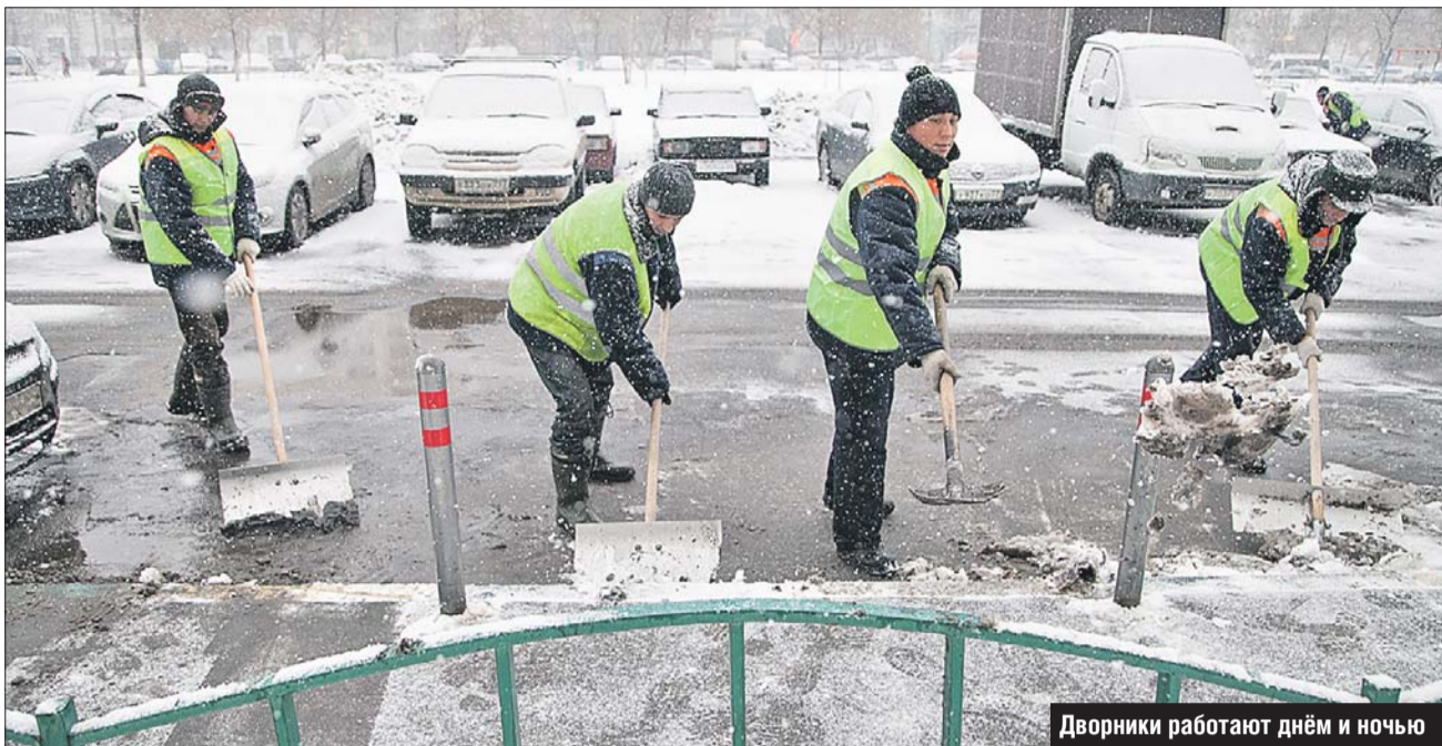
Дворники работают днём и ночью