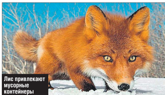
Лис привлекают мусорные контейнеры

Лисы в парке «Кузьминки-Люблино» этой зимой ведут себя особенно нахально. Как рассказали в Дирекции природных территорий, их видели даже в центральной части лесопарка. Хитрые животные смекнули, что возле человека им прокормиться легче, и начали «столоваться» возле мусорных контейнеров, совсем как бродячие собаки. Поэтому ГПБУ «Мосприрода» напоминает: если идёте в парк с собакой, к тому же предпочитаете уходить подальше,