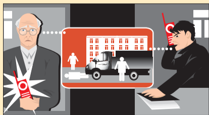
Схема №2 Лжереформа денег

Не верьте! Этот сценарий мошенничества продолжает оставаться самым «популярным». Перезвоните сначала вашему родственнику, который якобы об этом просит.