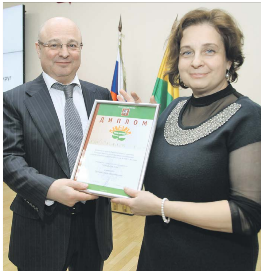
Префект Андрей Цыбин с заместителем директора школы №1987 Ириной Богачёвой

Префект Андрей Цыбин на коллегии префектуры вручил кубки и грамоты главам управ районов, ставших лучшими по показателям в области гражданской обороны, защиты населения от чрезвычайных ситуаций и обеспечения пожарной безопасности. 1-е ме-