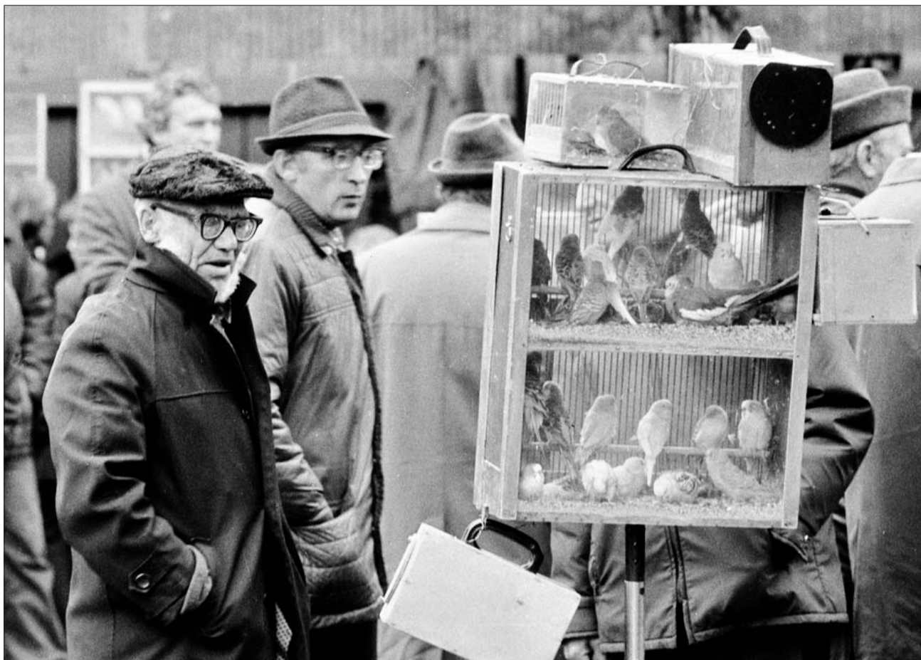
Таким был птичий рынок на Большой Калитниковской

— Покажи нам самое московское место, чтобы почувствовать дух го-