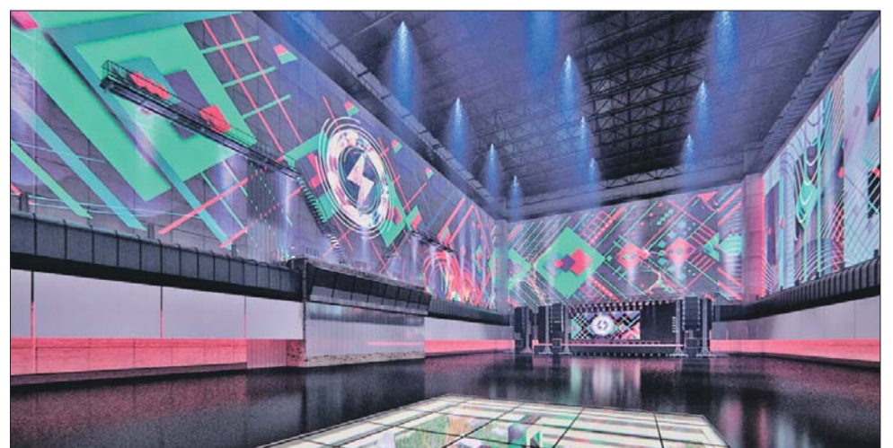
Здесь будут проводить выставки и фестивали