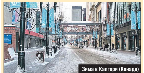
Зима в Калгари (Канада)