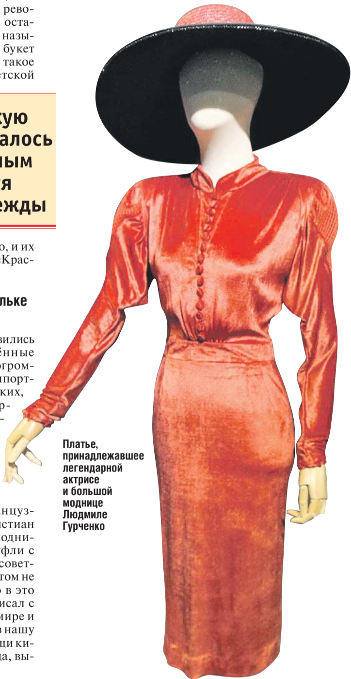
Платье, принадлежавшее легендарной актрисе и большой моднице Людмиле Гурченко

Записала Лариса Зелинская