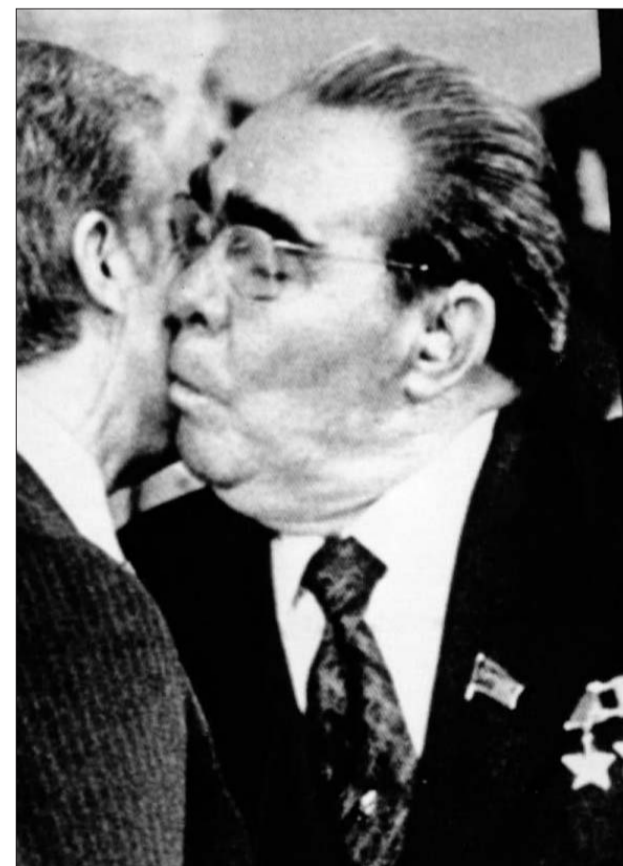
В тот раз, судя по настроению Брежнева, он вовсе не склонен был обмениваться дружественными поцелуями