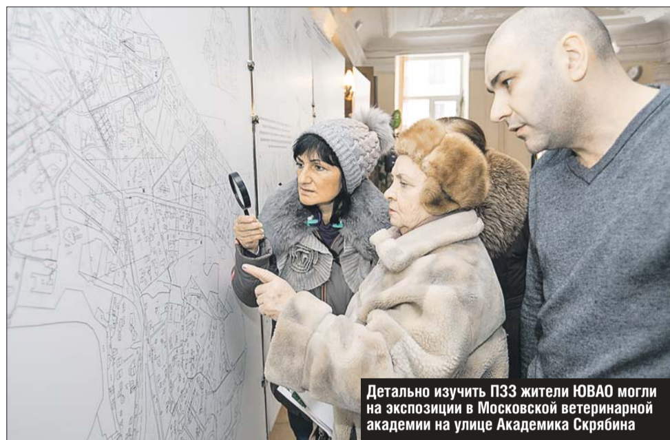
Детально изучить ПЗЗ жители ЮВАО могли на экспозиции в Московской ветеринарной академии на улице Академика Скрябина

В дополнение к основным картам документа на окружных экспозициях публичных слушаний горожане могут посмотреть и карту соцобъектов, которые планируют построить к 2025 году. Так, в ЮВАО предусмотрена постройка 20 детских садов и 11 школ, 14 культурно-досуговых