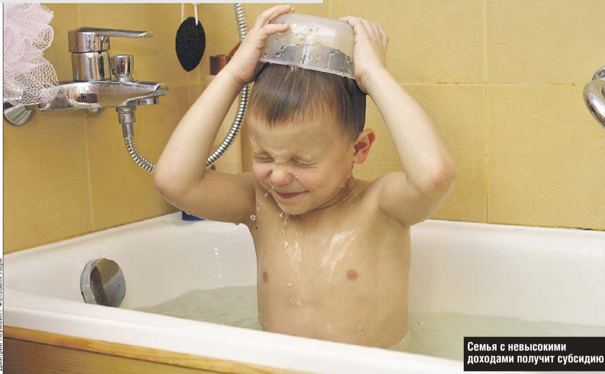
Семья с невысокими доходами получит субсидию

Последние три года тарифы на коммунальные услуги сдерживаются на уровне ниже инфляции. Общий рост тарифов на коммунальные услуги с 2014 по 2016 год составляет 26% при росте инфляции за тот же период 36%. В то же время Правительство Москвы контролирует обоснованность повышения тарифов поставщиками ресурсов и жёстко