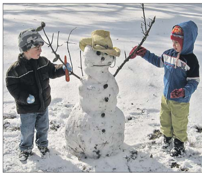
На конкурс снеговиков можно принести любые украшения и шляпы