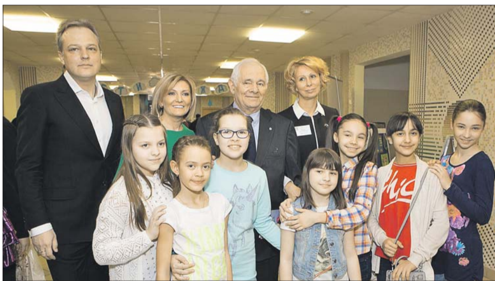
Благотворительный праздник «Дети дождя»