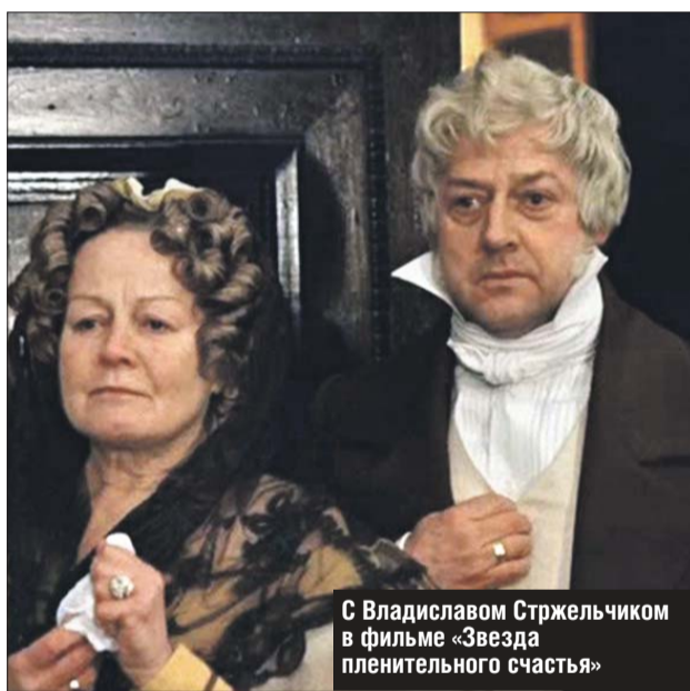
С Владиславом Стрельчиком в фильме «Звезда пленительного счастья»

Когда сказали, что арестуют её пятнадцатилетнюю дочь, Окуневская всё подписала