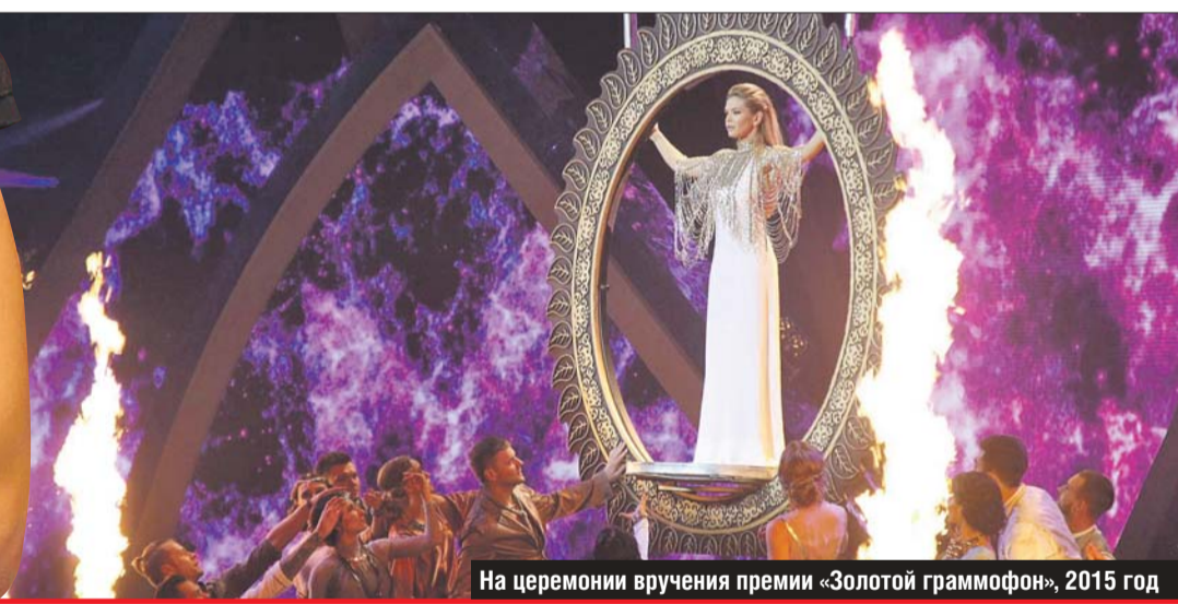
На церемонии вручения премии «Золотой граммофон», 2015 год