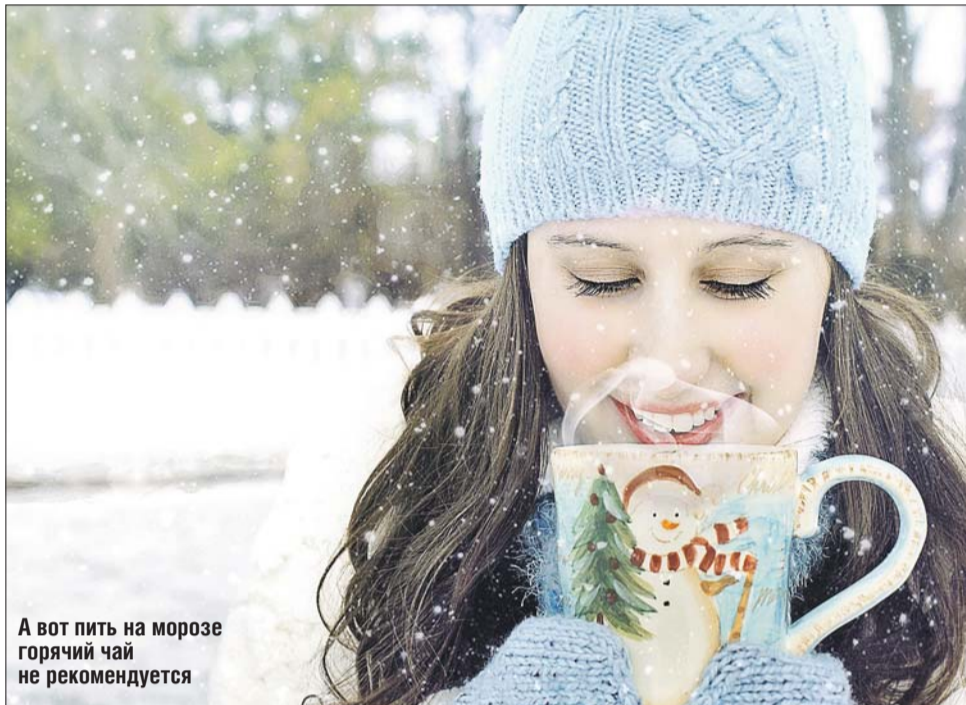
А вот пить на морозе горячий чай не рекомендуется