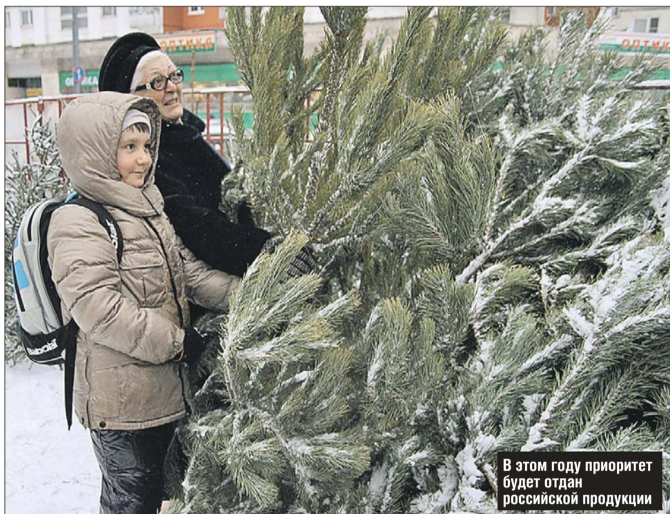
В этом году приоритет будет отдан российской продукции