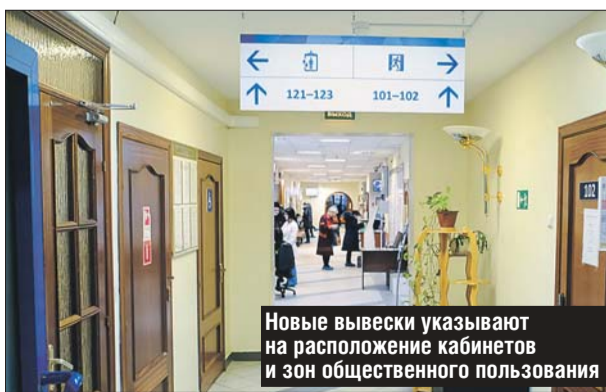
Новые вывески указывают на расположение кабинетов и зон общественного пользования

Новые вывески в поликлиниках указывают на расположение кабинетов, отделений и зон общественного пользования. Настенная и наполь-