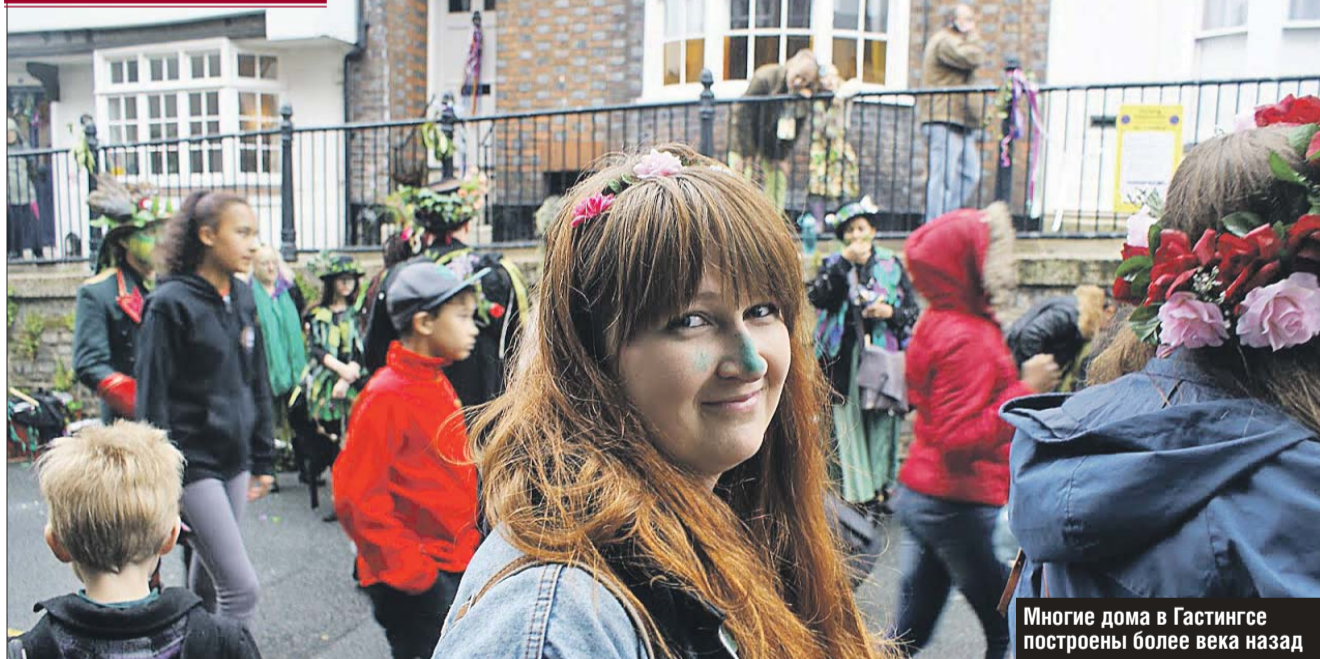
Многие дома в Гастингсе построены более века назад

Читайте «Юго-Восточный Курьер» и районные газеты ЮВАО