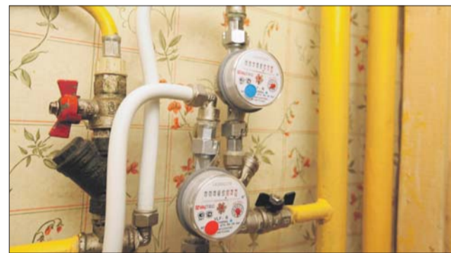
Со временем даже в бездействующем водосчётчике образуются солевые отложения