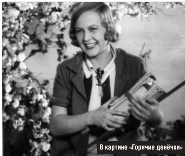
В картине «Горячие денёчки»