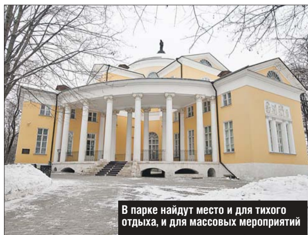
В парке найдут место и для тихого отдыха, и для массовых мероприятий

На территории усадьбы планируется создать зоны для прогулок, тихого отдыха, проведения массовых мероприятий и организации уличных выставок. Кроме того, там появятся велопарковки и несколько различных площадок — детские и спортивные, а также смотровая и танцевальная. На берегу пруда оборудуют причал с лодочной станцией, благоустроят велосипедные дорожки, которые в зимнее время будут преобразовываться в лыжную трассу.