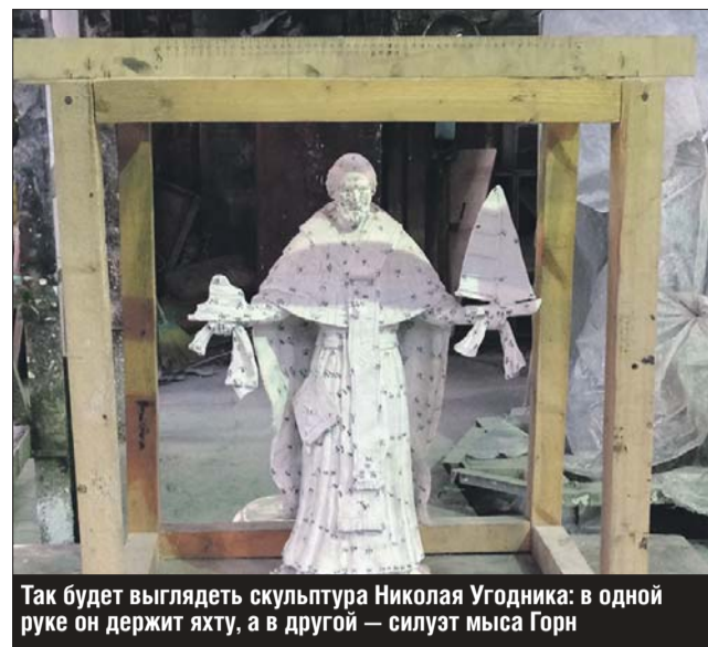
Так будет выглядеть скульптура Николая Угодника: в одной руке он держит яхту, а в другой — силуэт мыса Горн

— Вы обратили внимание, что в церквях наших мало молодых? Бабушки в основном. У нас в Федерации альпинизма 4 тысячи человек, и я очень радуюсь, когда спортсмены приходят на службу. В альпинистском лагере всегда делаю алтарь. Представьте себе: у подножия Джомолунгмы красота такая вокруг, а мы молимся.