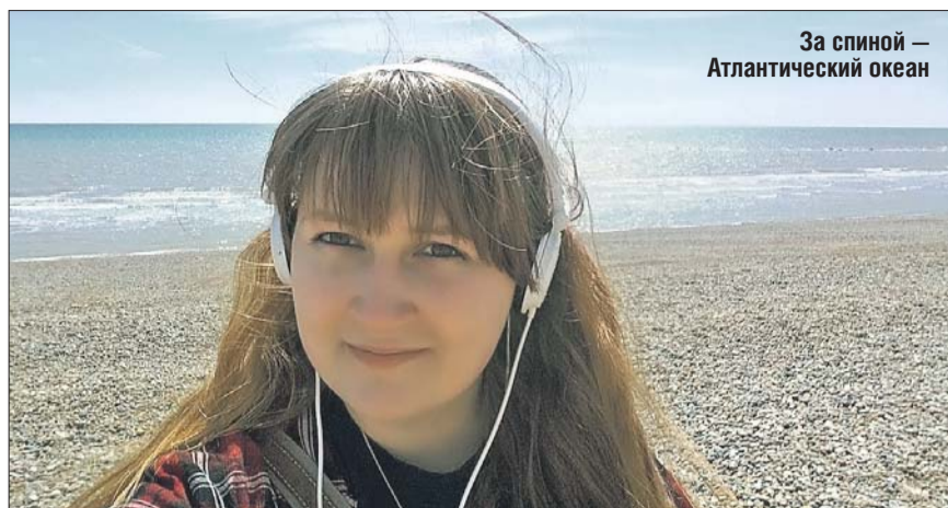
За спиной — Атлантический океан