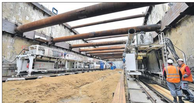
Тоннелепроходческий щит начал прокладывать Кожуховскую линию

Напомним: запуск Кожуховской линии метро