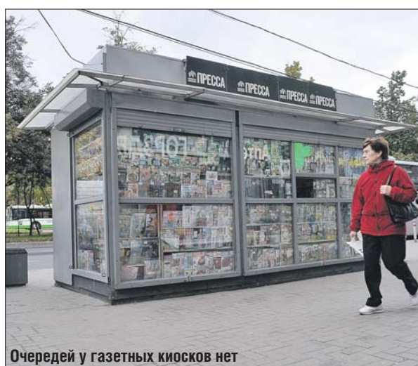
Очереди у газетных киосков нет

— Я не читаю новости в печатном варианте, давно забросил покупать газеты. Сейчас быстрее зайти на какой-нибудь новостной портал и найти всё, что интересует, либо просто пролистать страницу любого поисковика. Там регулярно публикуют последние новости дня.