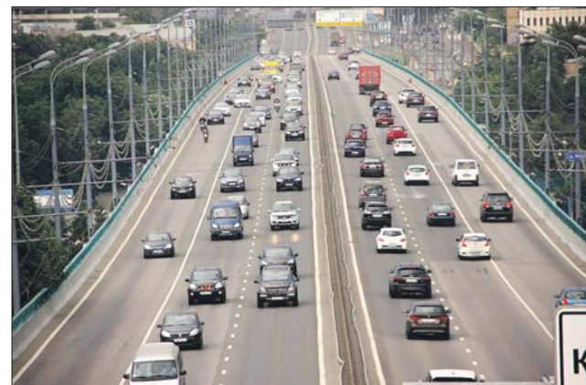
На МКАД станет меньше пробок