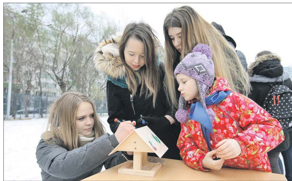
Студенты и школьники раскрасили кормушки для птиц