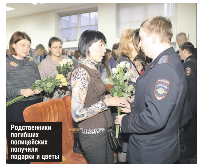
Родственники погибших полицейских получили подарки и цветы

По информации Кузьминской межрайонной прокуратуры