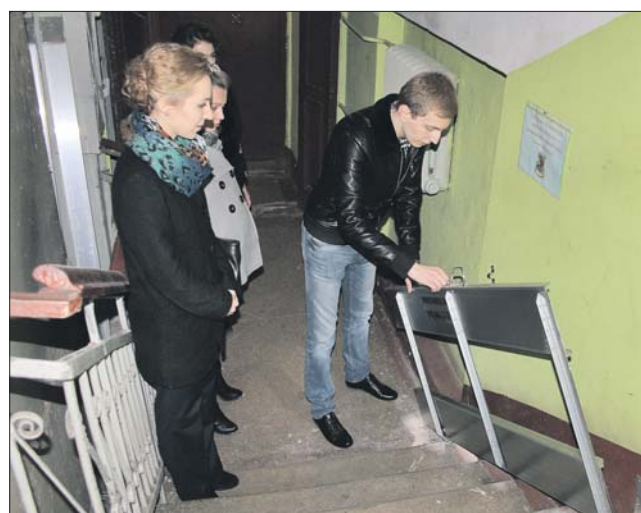
Члены Молодёжной палаты проверяют работу пандуса