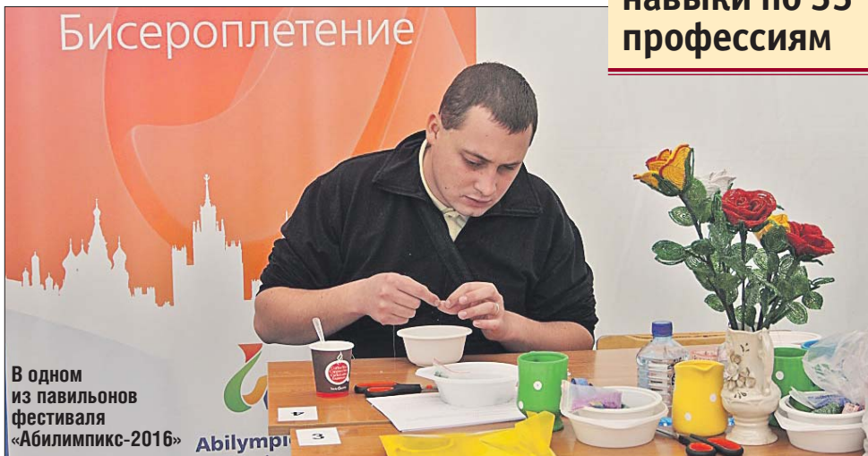
В одном из павильонов фестиваля «Абилимпикс-2016»