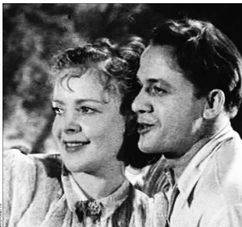
В фильме «Музыкальная история»

Актрисе не давали спать, допрашивали и ранним утром, и ночью