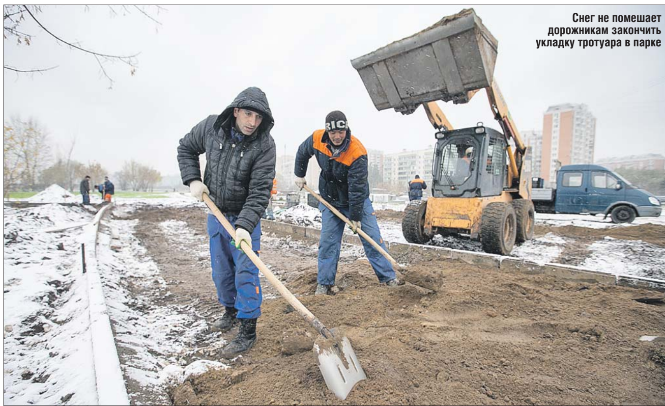
Снег не мешает дорожникам закончить укладку тротуара в парке