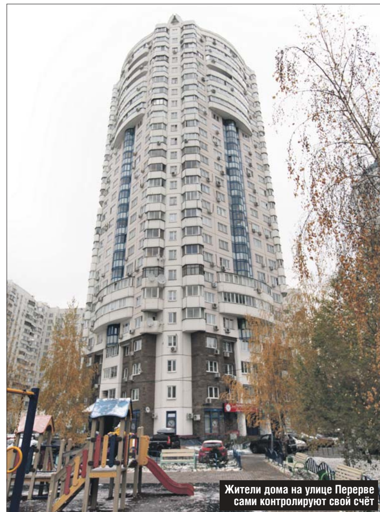
Жители дома на улице Перерве сами контролируют свой счёт

— Но у нас не было никаких сомнений в том, что надо вы-