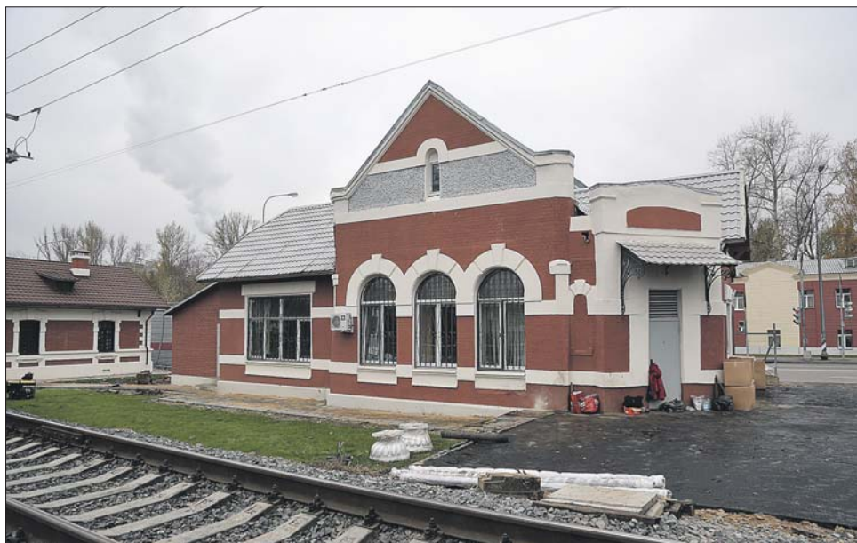
Вокзал станции Лефортово

ЗАДАВАЙТЕ ВОПРОСЫ, ПРЕДЛАГАЙТЕ ТЕМЫ ДЛЯ ПУБЛИКАЦИЙ