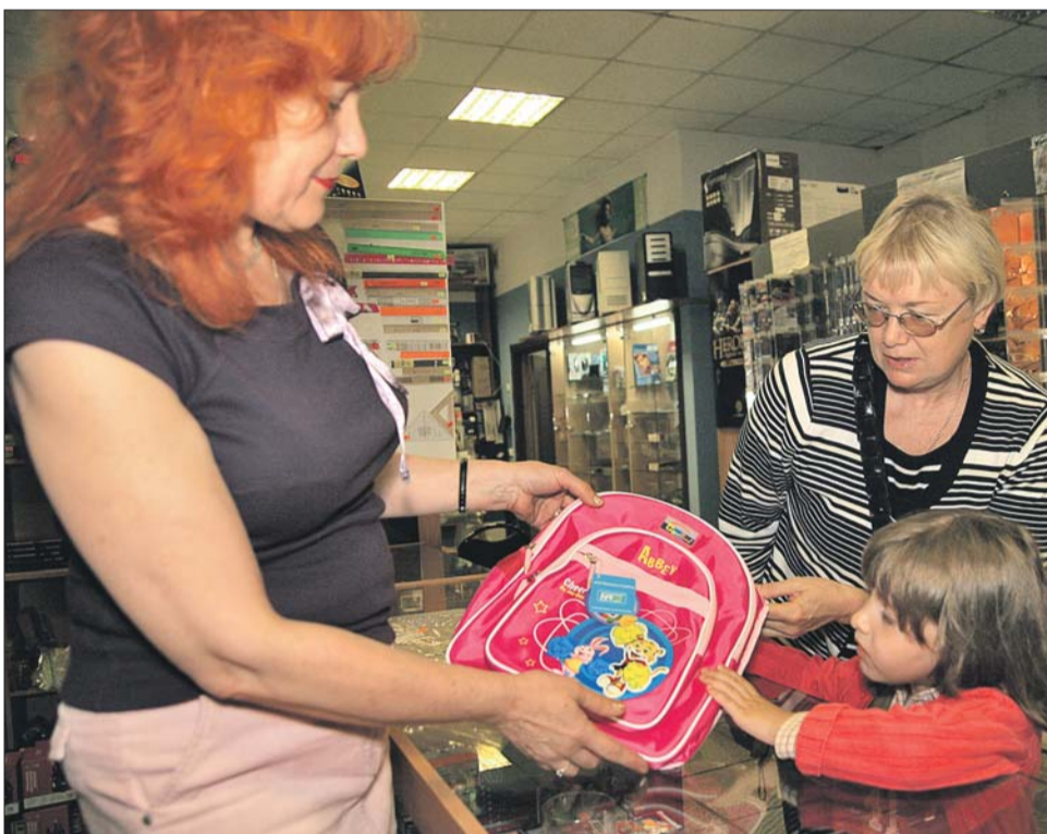
В торговых шале школьного базара посетителей ждёт широчайший ассортимент канцтоваров

Те, кто будет регулярно посещать занятия, научатся готовить с десятком вкуснейших десертов — даниш с ягодами, шоколадный мини-круассан, фруктово-ягодный компот, улитку с изюмом и кремом. Чтобы не отпра-