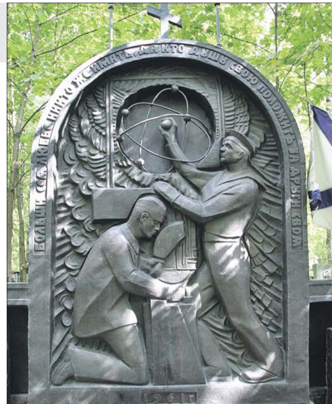
Памятник подводникам лодки «К-19»

Падение из окна стало причиной смерти артиста Александра Белявского (Фокс из «Место встречи изменить нельзя», Володя из «Июльского дождя»). Артист снялся более чем в ста фильмах. В последние годы сильно болел — не мог оправиться от инсульта. Урна с прахом артиста захоронена рядом с прахом его сыновей. Один погиб в раннем детстве, второй — в 20 лет, и тоже выпал из окна. На общем памятнике надпись: «Мы вас всех любим и помним».