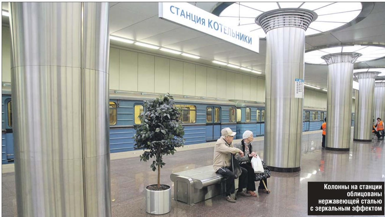
Колонны на станции облицованы нержавеющей сталью с зеркальным эффектом