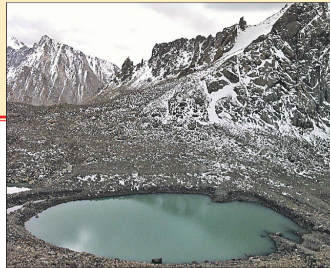
Гора Кайлас (Тибет)