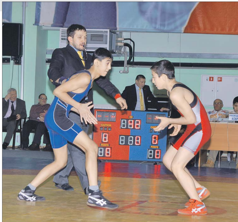
У юных борцов по две тренировки в день — утром и вечером

— Отлично выбрана команда на Олимпиаду, ребята побеждают. Что касается допинга, то нам, в греко-римской борьбе, допинг неинтересен, потому что если мы будем его кушать, у нас вес будет расти. Борцам всю жизнь давали мельдоний — это сердечный препарат. Когда я боролся, мы приходили на тренировку, а на столах везде таблетки лежали. Сейчас его вве-