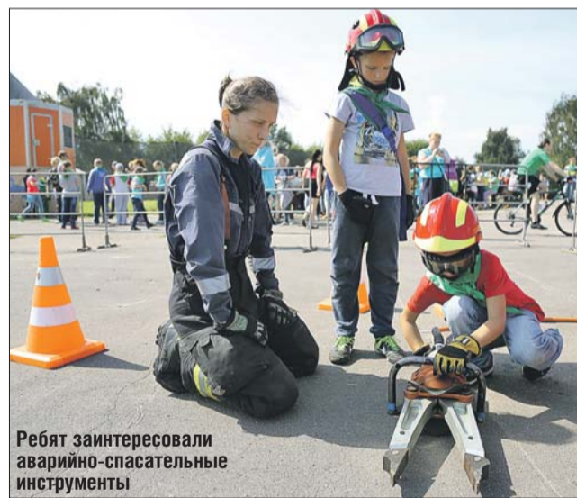
Ребята заинтересовались аварийно-спасательными инструментами

по основам безопасности жизнедеятельности — «Безопасность на дорогах ради безопасности жизни».