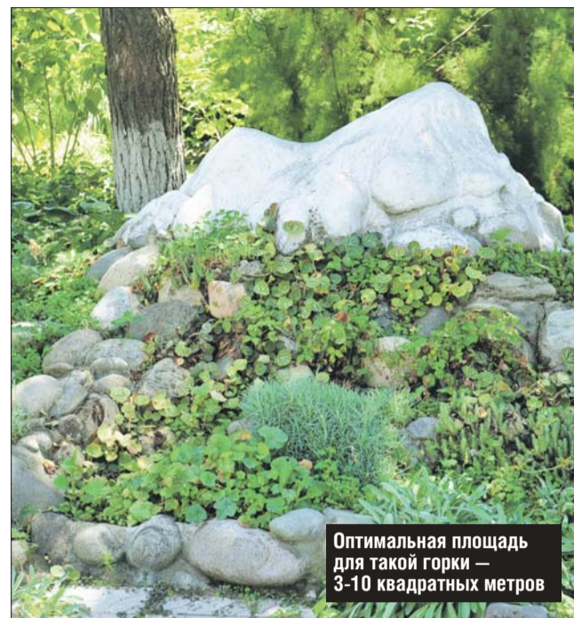
Оптимальная площадь для такой горки — 3-10 квадратных метров

чивости камни укладывают под углом около 30 градусов от вертикали. Таким образом создаётся стена, в которой можно разместить огромное количество растений. На-