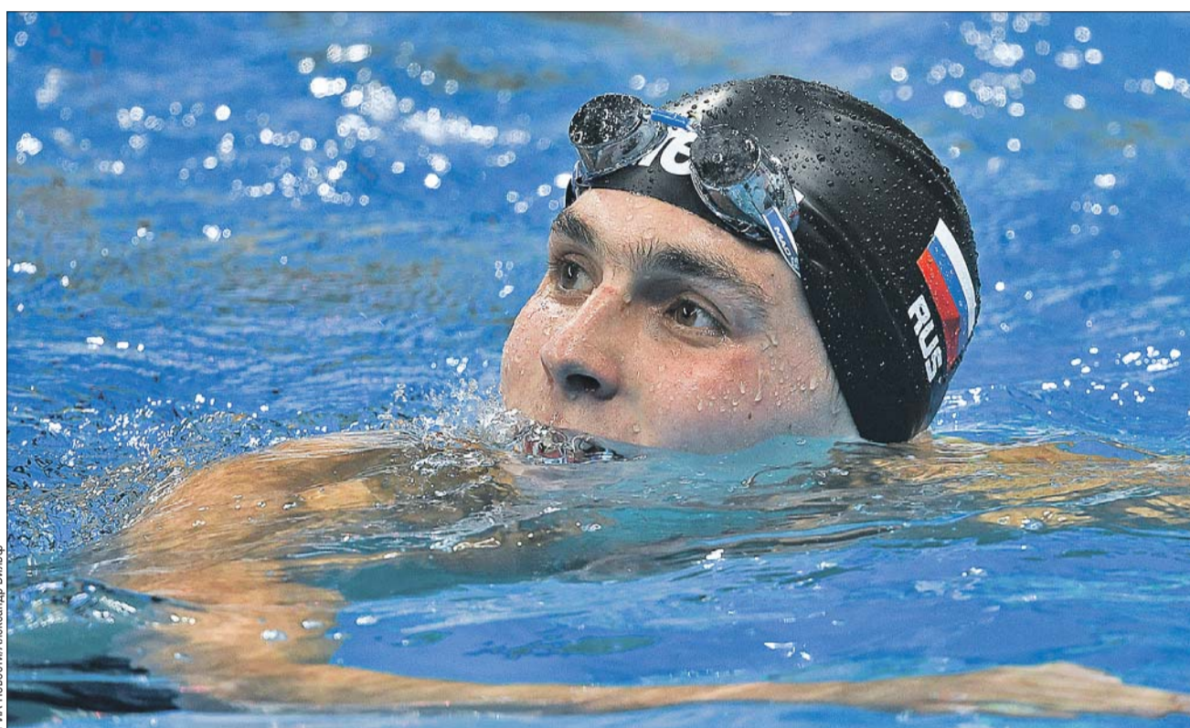
РИА Новости/Александр Вильф

Плаванием Антон начал заниматься с пяти лет. В бассейн спортивной школы олимпийского резерва по плаванию «Юность Москвы» его привела мама. О рекордах сына она не помышляла, просто хотела укрепить его иммунитет. Первым тренером Антона стала Наталья Быкова, спустя несколько лет за будуще-