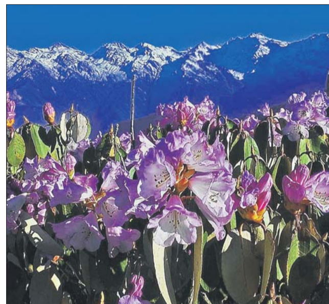
Цветущие рододендроны в долине Хеламбу (Непал)

ломников она становится в год Лошади, когда, как считается, сила этого места увеличивается в разы. В это время Федорович с группой собирались посетить Кайлас.