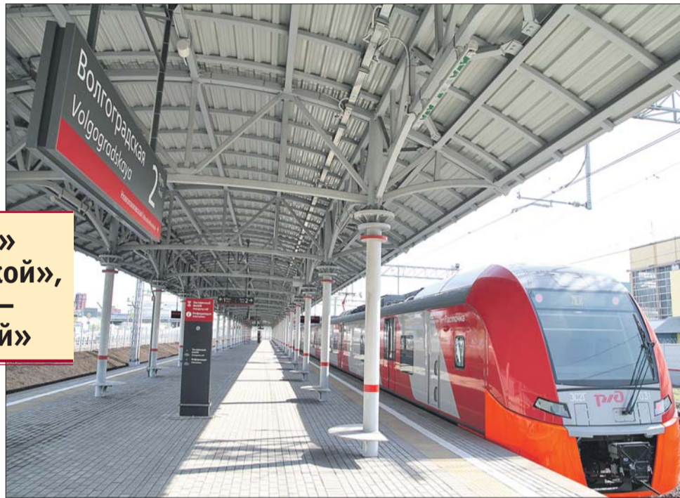
Станцию «Волгоградская» решили переименовать, потому что она находится в удалении от станции метро «Волгоградский проспект»