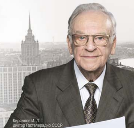
Кириллов И. Л. — директор Гостелерадио СССР

Чтоб экономить, возьмите в привычку Делать покупки в аптеках СТОЛИЧКИ!