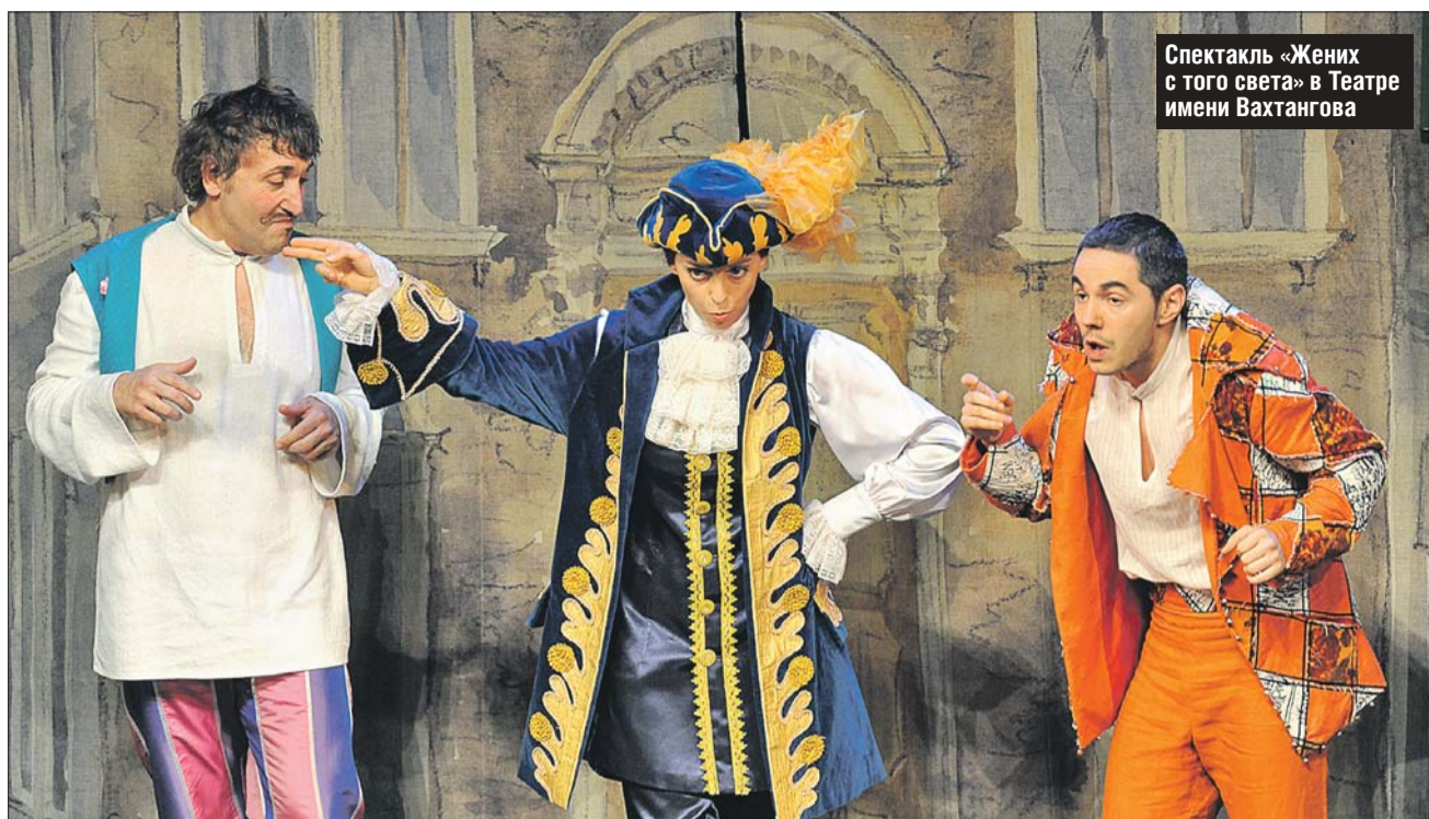
Спектакль «Жених с того света» в Театре имени Вахтангова