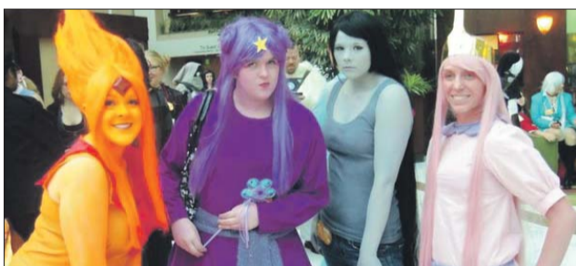
«Ожившие» герои мультсериала Adventure Time («Время приключений»)

— Основной сюжет действия построен на основе популярного молодёжного мультсериала Adventure Time («Время приключений»), — рассказывает