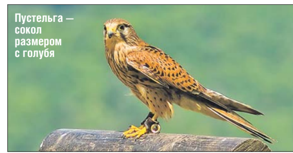
Пустельга — сокол размером с голубя