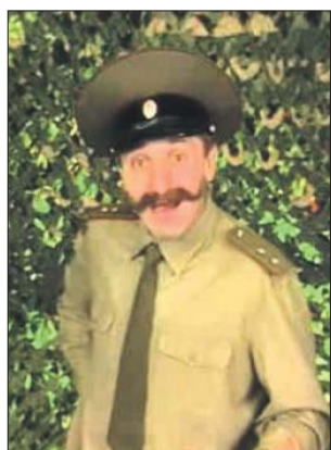
В роли прапорщика

потерял несколько ролей только потому, что снимался в юмористических передачах. Когда узнавали, что юморист, — отказывали.