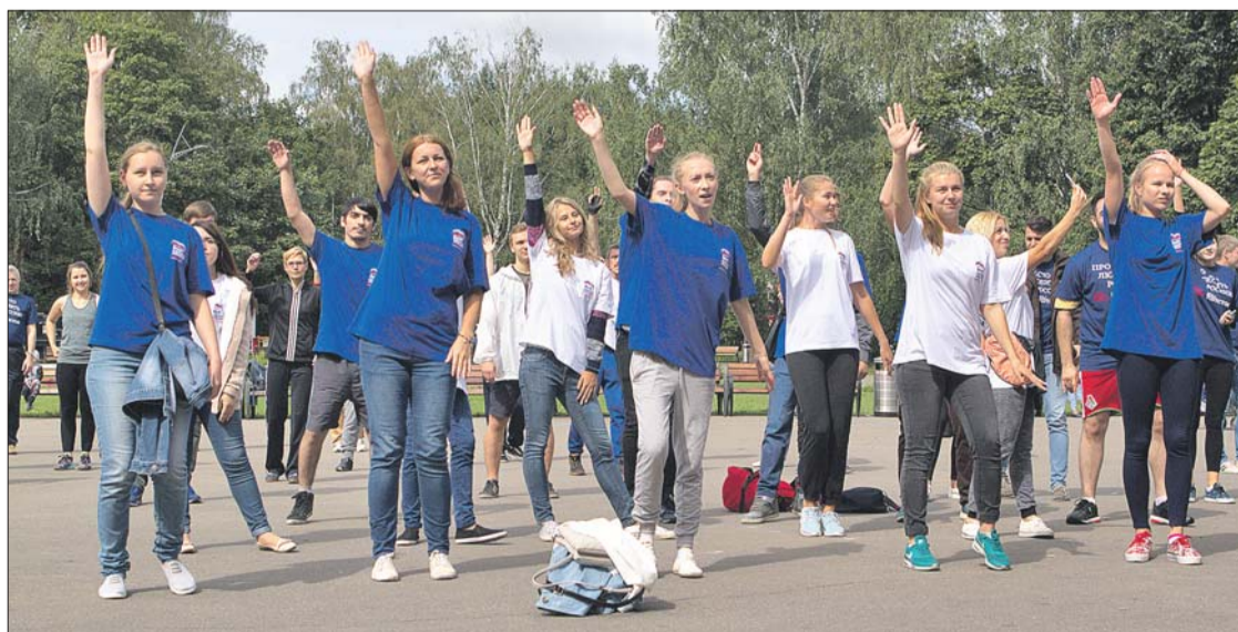
У главной сцены парка «Кузьминки»