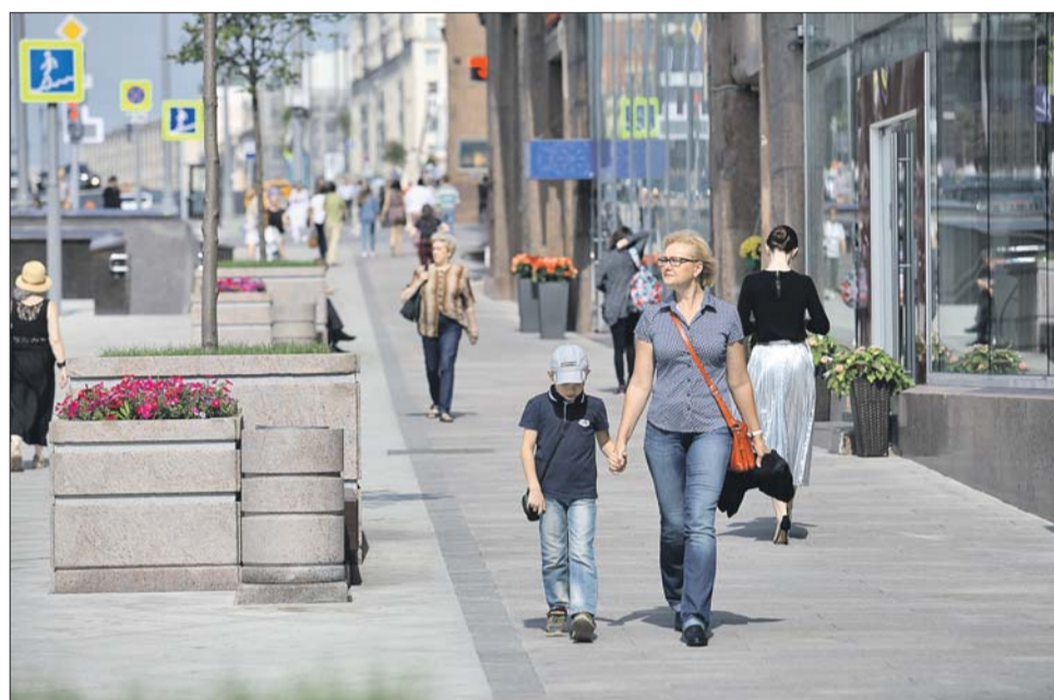
Тротуары на Тверской вымощены крупной гранитной плиткой

Полностью автомобильное движение по Тверской улице перекрывалось дважды. 4 и 5 июня были проведены работы по прокладке кабельной канализации поперёк Тверской улицы. При частичном перекрытии движения такие работы заняли бы до трёх недель. Второй раз Тверская была перекрыта 24 июля для укладки асфальта на проезжей части «единым ковром», что существенно повысило экс-