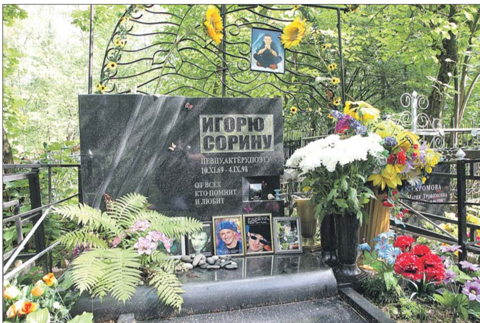
Могилы Игоря Сорина всегда в цветах