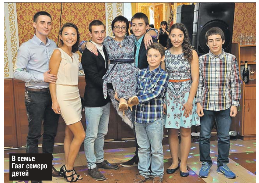
В семье Гагг семеро детей