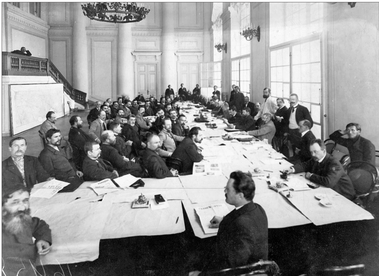
Заседание фракции трудовиков

В итоге большинство голосов в третьей Думе было отдано «партии власти» — октябристам: 154 места. А вот представительство кадетов, трудовиков, социал-демократов и национальных групп заметно уменьшилось. Эсеры выборы бойкотировали. Царское правительство после двух неудачных попыток получило наконец договороспособный парламент. Только новая Дума прак-