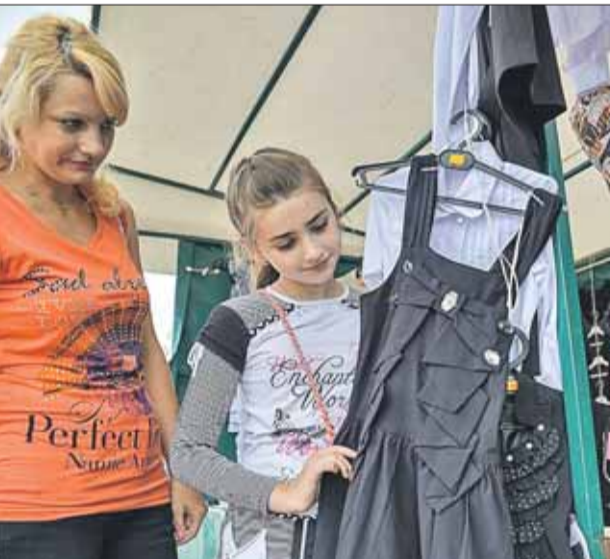
Благотворительная акция «Готовимся к школе!» будет проходить в течение нескольких дней

— Детям очень-очень нужны тетради, дневники, ручки и карандаши, — рассказывает заведующая отделени-