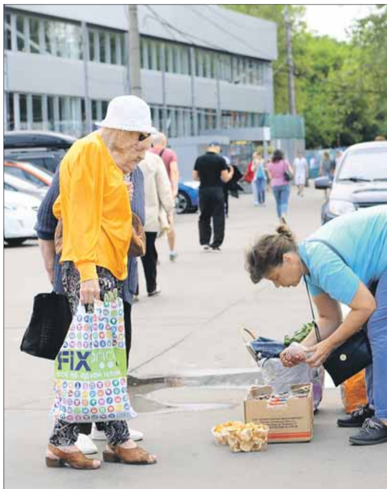
Какого качества грибы у уличных торговцев — неизвестно...

Роспотребнадзор города Москвы проводит круглогодичные проверки качества этого продукта, в том числе и во время сезонного сбора грибов. Так, в 2015 году было исследовано около трёх тысяч проб. Нарушения по наличию в грибах опасных химических веществ были выявлены в 3,4% взятых проб. Проверка выявила превышение содержания в грибах ртути и мышьяка в 2,2% и в 3,3% проб соответственно. Более 7% проб показали повышенное содержание в грибах радиоактивных веществ. В итоге с реализации сняли около 6,7 тонны грибов. С начала 2016 года уже исследованы около 220 проб. Превышение содержания опасных химических веществ выявлено в 1,6% случаев.