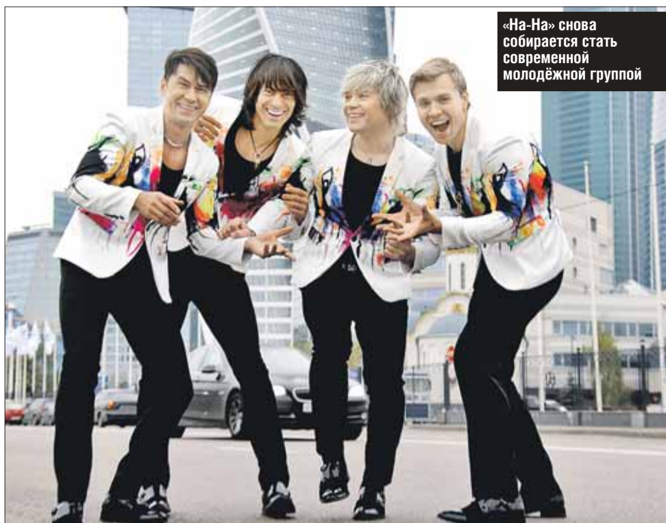
«На-На» снова собирается стать современной молодёжной группой