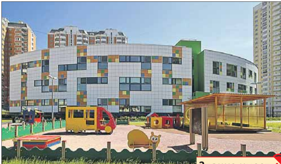
Детский сад на Люберецких Полях