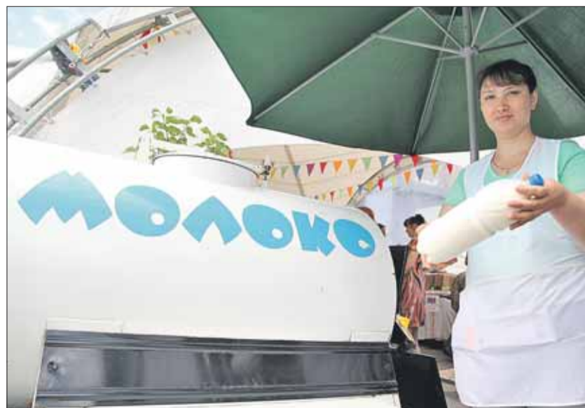
На ярмарке на Краснодарской будут торговать продукцией из Тамбовской и Кировской областей