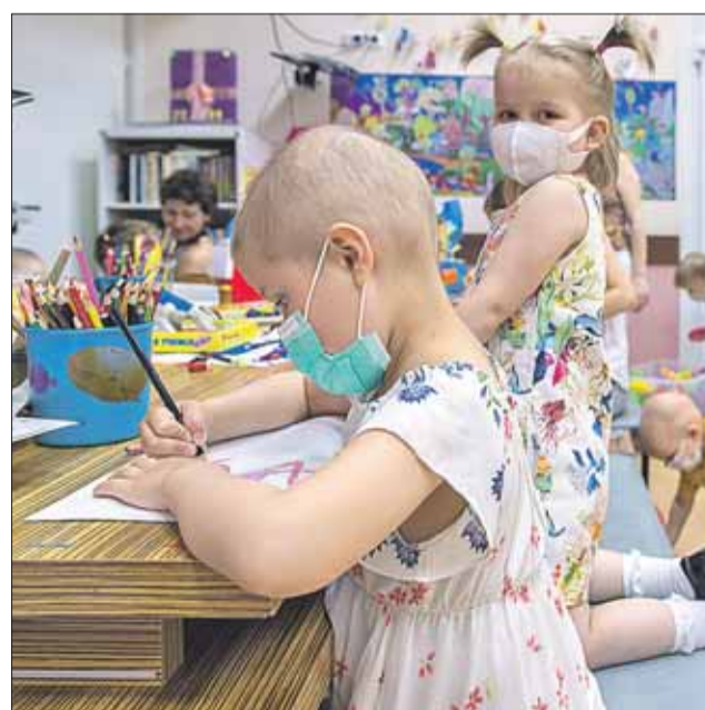
Совсем скоро Морозовская больница примет новый облик

— Сейчас больница модернизируется, мы начали своё посещение с министерством здравоохранения и