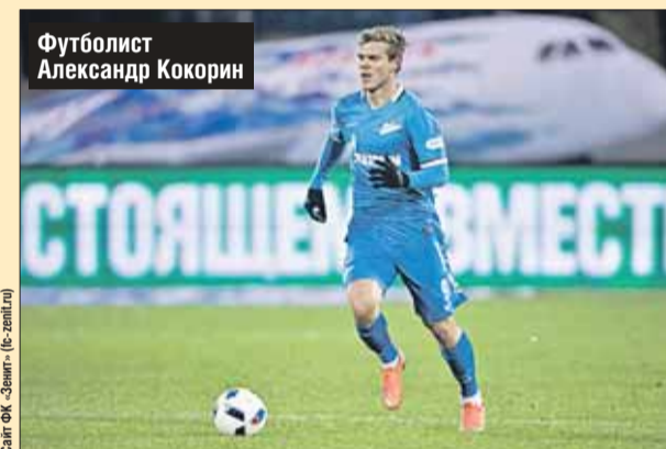
Футболист Александр Кокорин