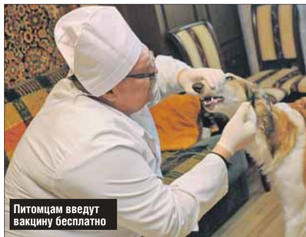
Питомцам введут вакцину бесплатно

Выездной прививочный пункт, где можно вакцинировать домашних питомцев от бешенства, будет работать в районе Лефортово 19 августа. Ветеринары приедут для этого в диспетчерскую на Волочаевской ул., 12. Как сообщили на станции по борьбе с болезнями животных ЮВАО, прививочный пункт будет работать с 17.00 до 19.00. Прививки сделают бесплатно.