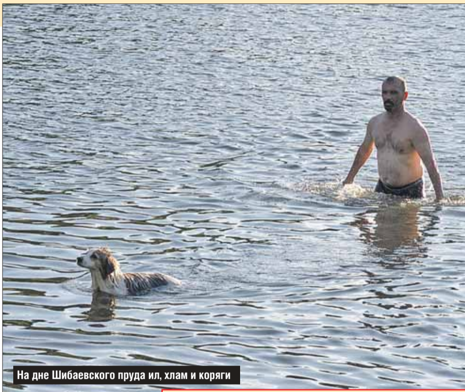
На дне Шибавского пруда ил, хлам и коряги