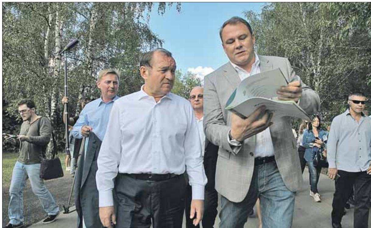
Выездное совещание в Жулебинском лесопарке

В этом году пристальное внимание на ситуацию обратил член общественного совета ЮВАО журналист Пётр Толстой. Он много встречался с жителями Жулебина, которые требовали навести