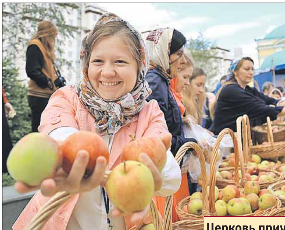
Церковь наполнила древний славянский праздник урожая новым содержанием

В Библии Господь выносит приговор: «Проклята земля за тебя, произрастит она тернии...» Мёд, орехи, фрукты воспринимались верующими как Божия милость, знак любви и прощения.