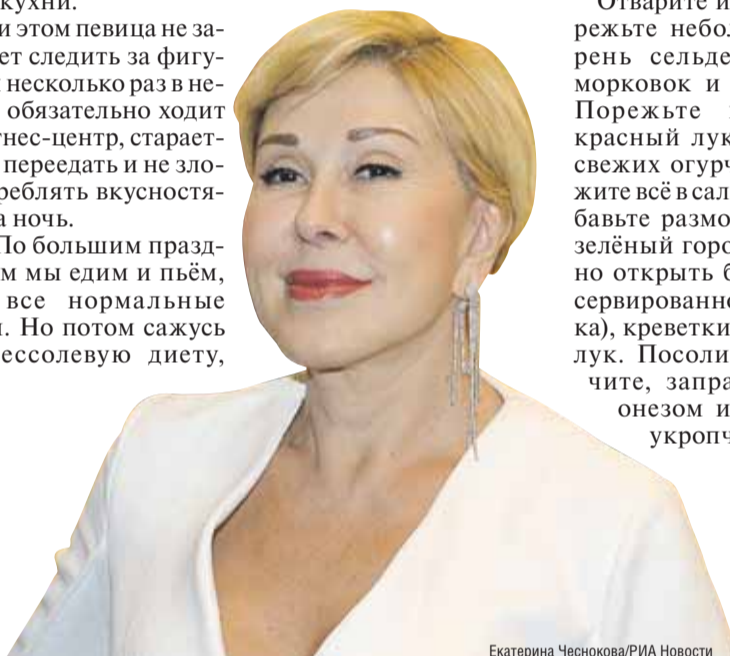
Екатерина Чеснокова/РИА Новости