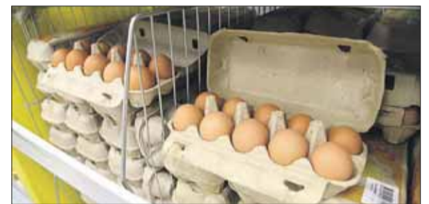
Если яйца хранятся на полках без охлаждения — это нарушение