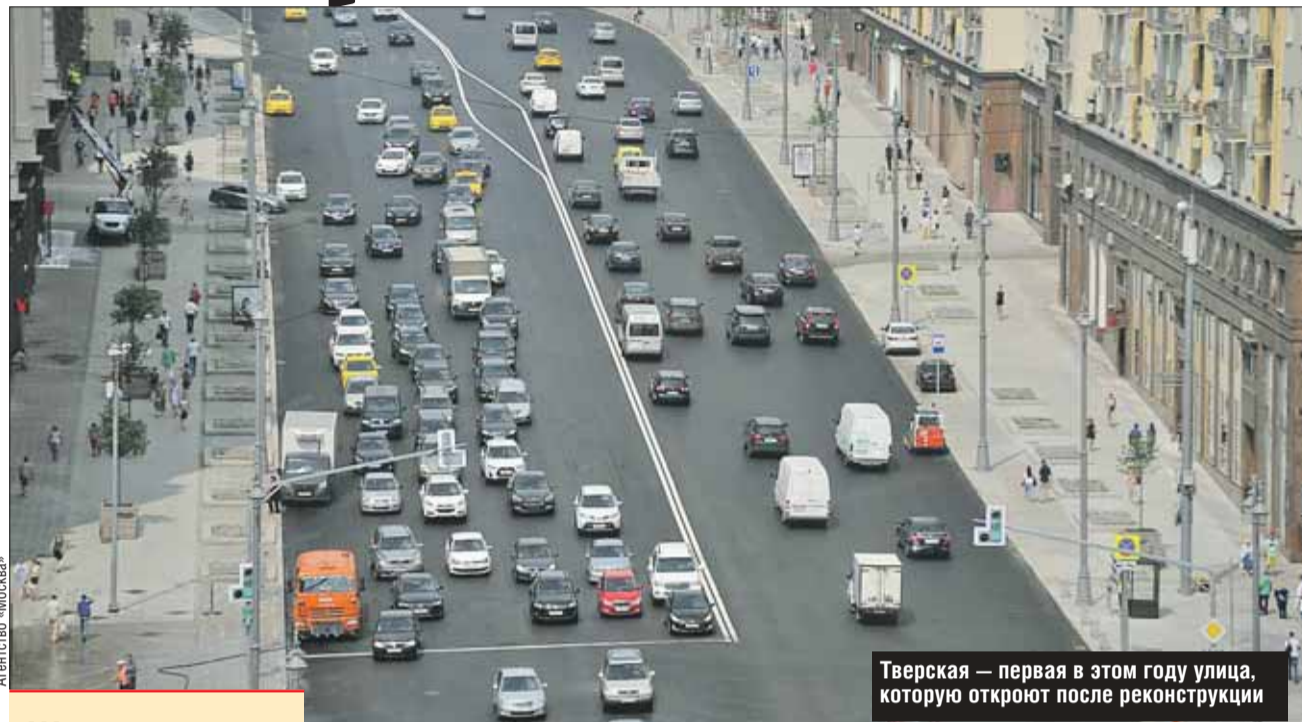
Тверская — первая в этом году улица, которую откроют после реконструкции

Применение в технологии современного модифицированного битума, разработанного с учётом климатических условий, даёт возможность улучшить свойства дорожного покрытия и увеличить срок его службы. Проез-