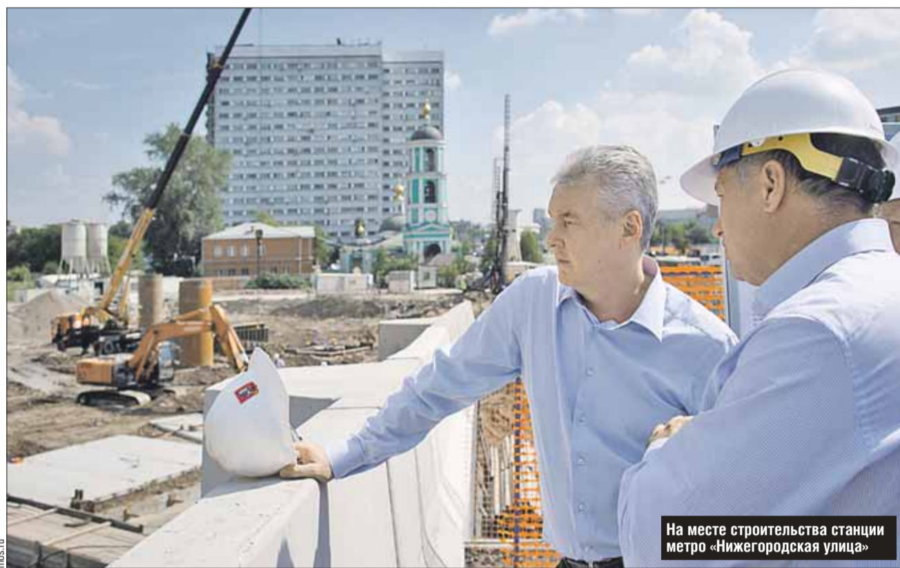
На месте строительства станции метро «Нижегородская улица»

— Узел объединит радиальное направление железной дороги на Нижний Новгород, Московское центральное кольцо, Третий пересадочный контур метрополитена и новую радиальную ветку метро-