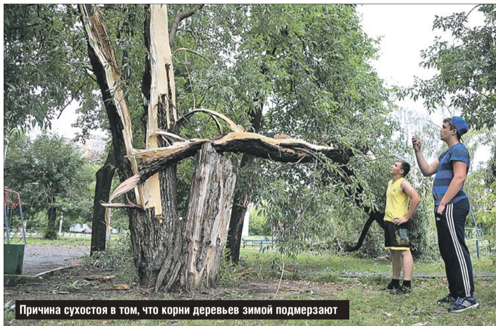
Причина сухостоя в том, что корни деревьев зимой подмерзают

За городом деревья каждую осень получают мощную подпитку: толстый слой опавших листьев превращается в перегной, в нём содержатся минеральные вещества, необходимые для роста растений, живут дождевые черви, которые рыхлят землю, насекомые, которые служат кормом для птиц. А из-под городских деревьев опавшие листья продолжают сгребать граблями. Кроме того, в лесу слой