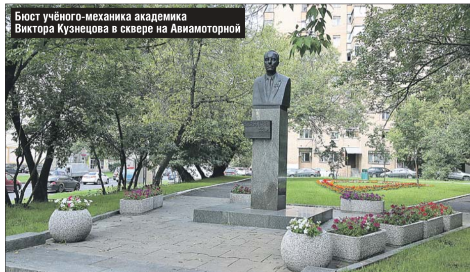
Бюст учёного-механика академика Виктора Кузнецова в сквере на Авиамоторной