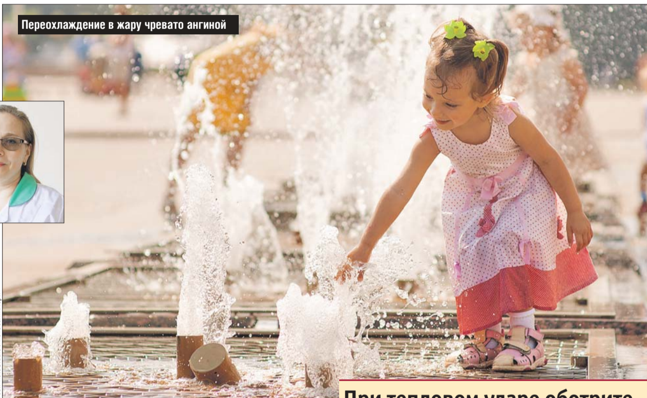
Переохлаждение в жару чревато ангиной

Купаться можно только в местах, официально разрешённых для купания, и ни в коем случае — в Кузьминском пруду. Это замкнутый водоём, в нём много различных инфекций, которые никто не обеззараживает. Летом очень легко подхватить, например, кишечную инфекцию, и,