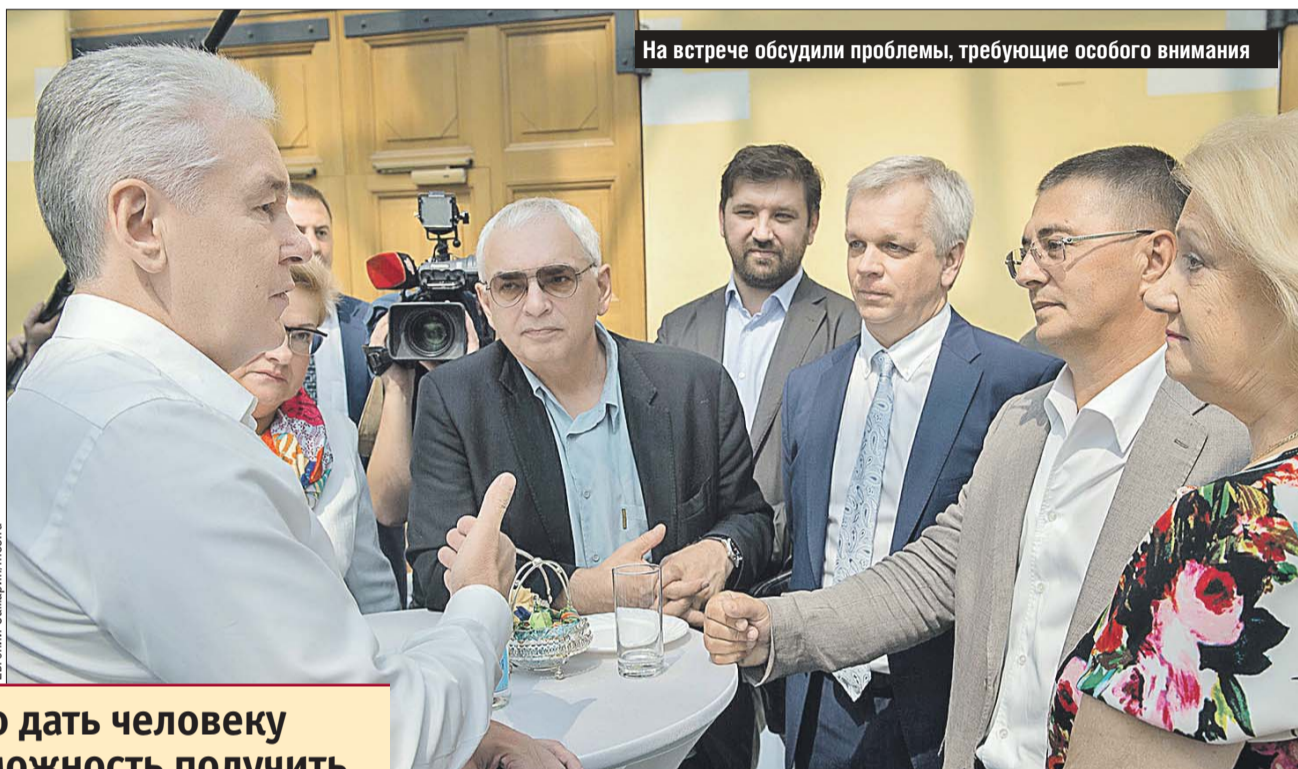
На встрече обсудили проблемы, требующие особого внимания

— Вы своим трудом, своим талантом создали собственное имя, сделали многое для своих коллективов, для города, для страны. Здесь собрались люди, которые активно поддерживали президента. Поддерживали «Единую Россию», которую создавал президент, многие из вас были доверенными лицами на выборах мэра Москвы. Спасибо за ваше доверие. Сегодня мы снова стоим перед выбором депутатов в Госдуму, речь идёт не только о выборах конкретных депутатов, речь идёт о выборе направления движения и развития нашей страны.