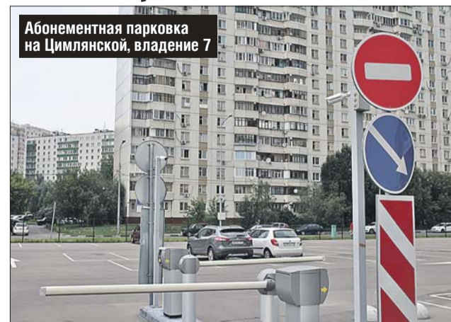
Абонементная парковка на Цимлянской, владение 7

Абонемент приобретается на один календарный месяц, и купить его нужно не позднее чем за пять дней до желаемого размещения автомобиля. По окончании месяца абонемент можно продлить. В Капотне месяц пользования парковкой обойдётся в 2700 рублей, а на