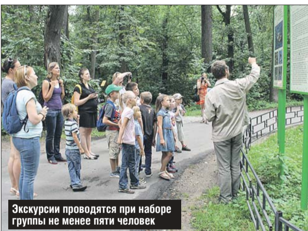
Экскурсии проводятся при наборе группы не менее пяти человек