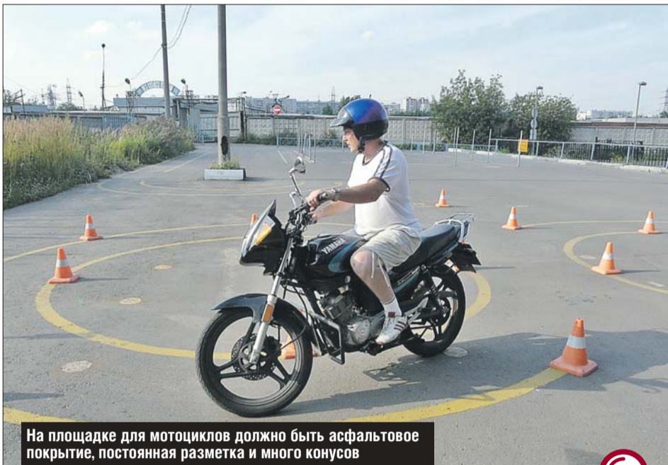
На площадке для мотоциклов должно быть асфальтовое покрытие, постоянная разметка и много конусов

Перед поступлением в школу проверьте, есть ли у неё лицензия Департамента образования и заключение Управления ГИБДД Москвы о соответствии материально-технической базы школы установленным требованиям. Посмотрите и образец договора между учеником и школой: его