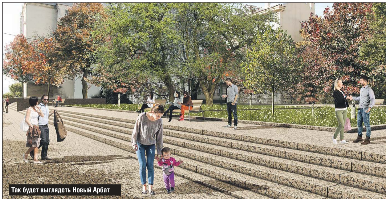
Так будет выглядеть Новый Арбат

— Мы попытались воссоздать тот облик Тверской, по которой ходили