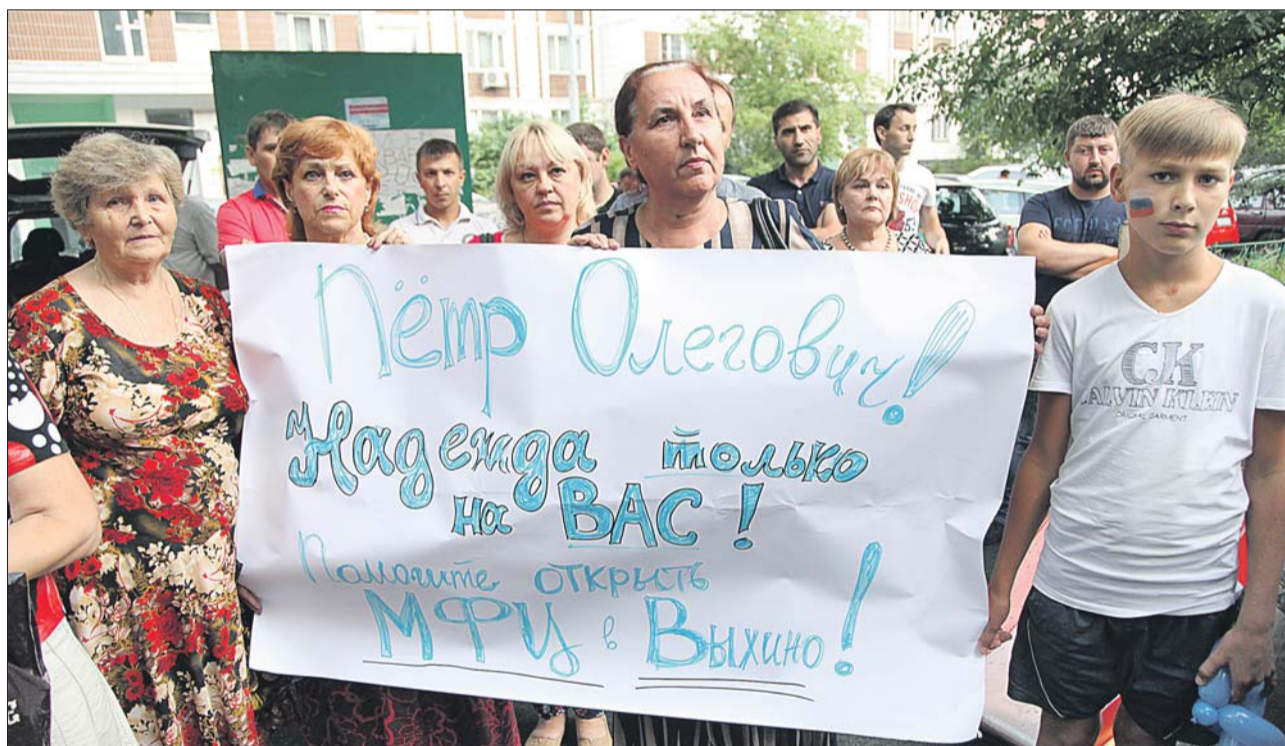
Тележурналист Пётр Толстой встретился с местными жителями на Самаркандском бульваре