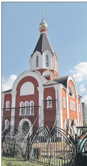
Храм Святой мученицы Татианы Римской на Краснодарской улице

Чуть меньше года потребовалось строителям для возведения деревянного храма в честь преподобного