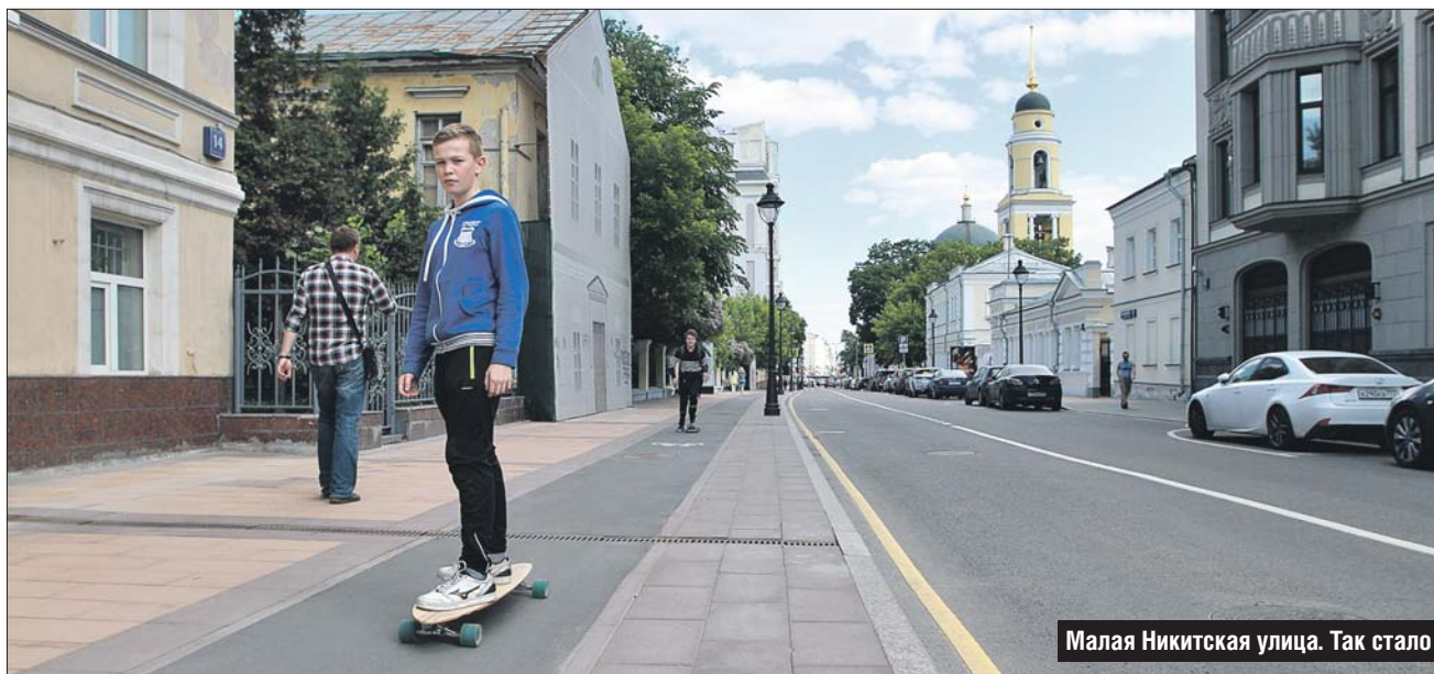
Малая Никитская улица. Так стало

— Мы очень любим сюда ходить. Тут просторно