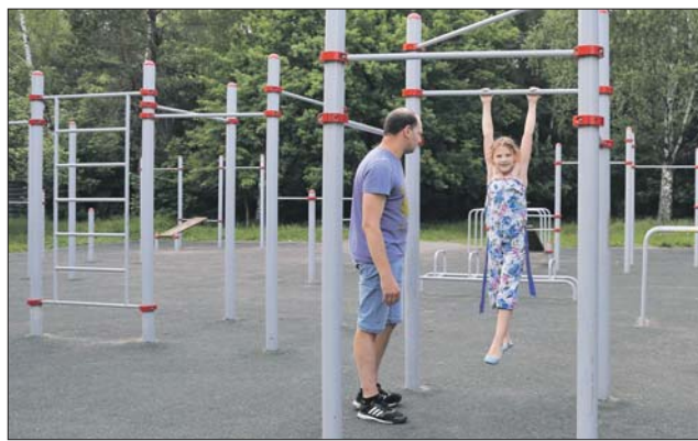
Спортивная площадка на улице Заречье, 7