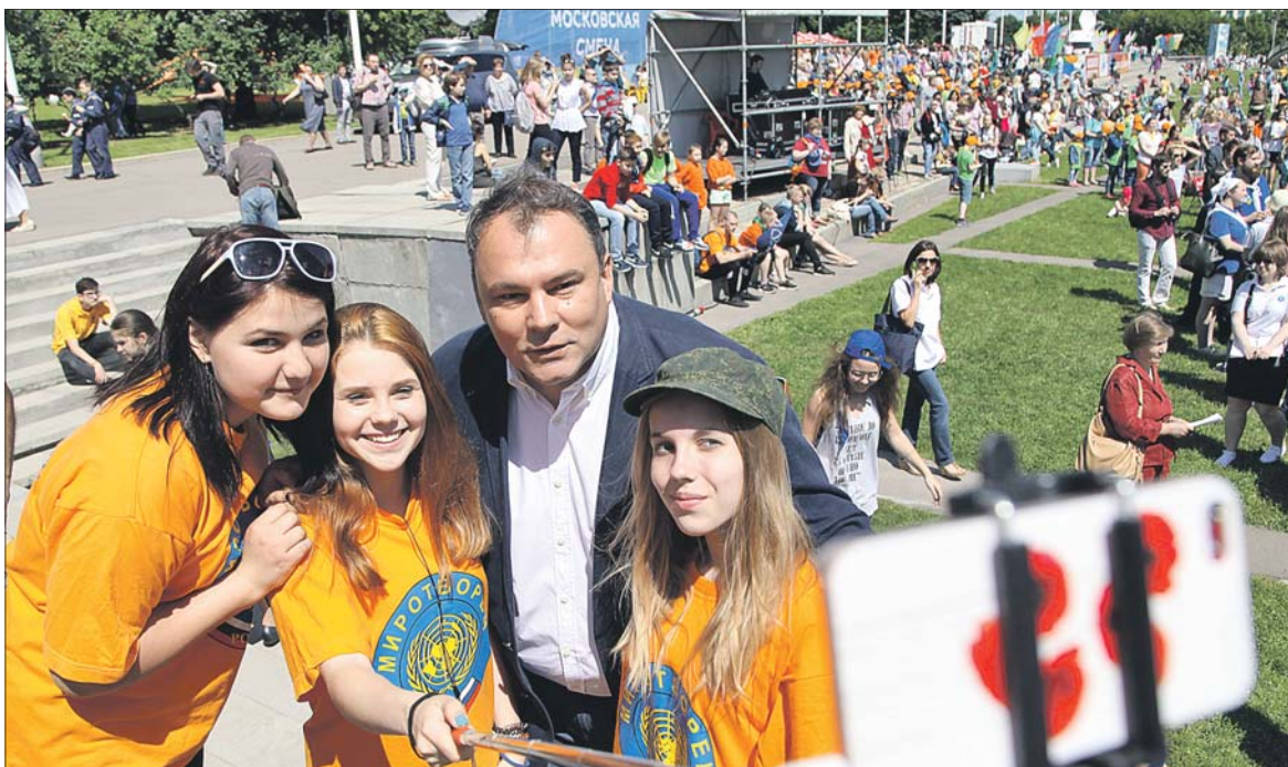
В церемонии запуска проекта «Московская смена» на Воробьёвых горах принял участие тележурналист Пётр Толстой

Для ребят будут организованы полноценный отдых, спортивные, культурные мероприятия, экскурсии, трёхразовое бесплатное питание. Все лагеря будут работать с 9.00 до 18.00.