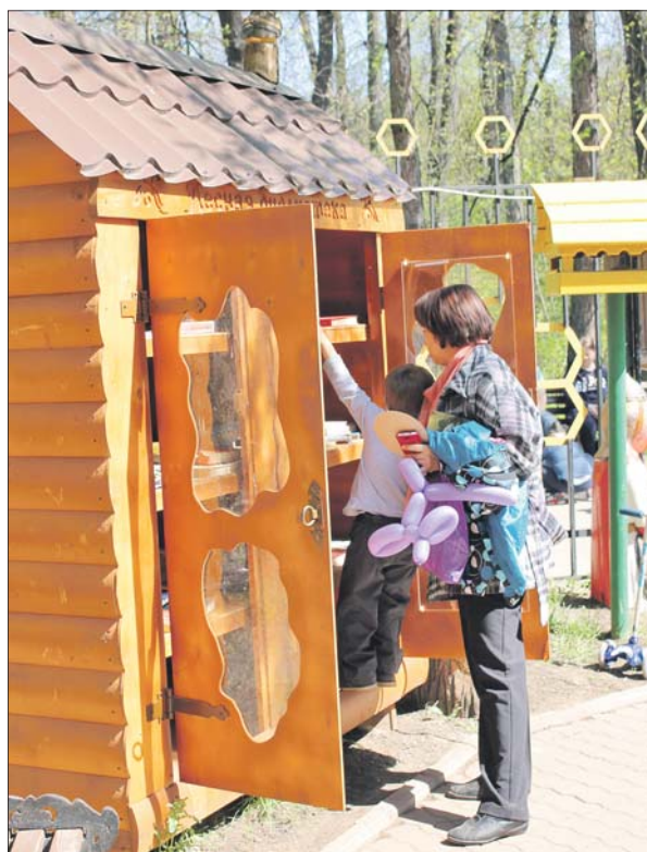
Вот так выглядит книжный шкаф в парке «Кузьминки-Люблино»