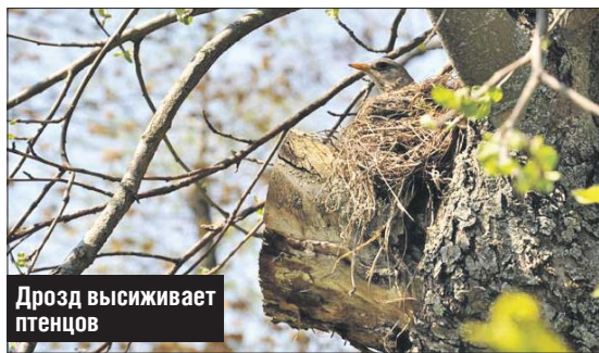
Дрозд высиживает птенцов