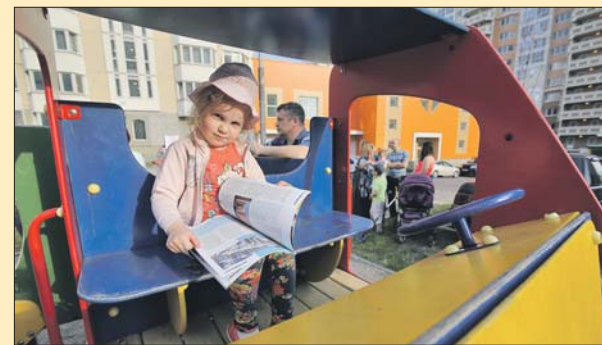
Ребёнок читает охотнее, если его кто-то слушает

И это тоже не только о литературе. Ведь и в жизни чаще бывает счастлив не тот, кто говорит, а тот, кого слушают и понимают.