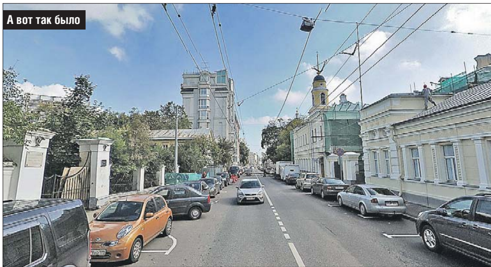
А вот так было

стало, людей много, все улыбаются. Правда, к качелям не прорваться, но на лавочке нам тоже хорошо, — с улыбкой отвечают на мой вопрос молодые люди.