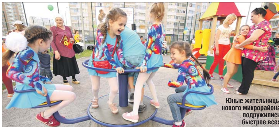
Юные жильницы нового микрорайона подружились быстрее всех

— Часто бывает так, что люди не знают, кто живёт