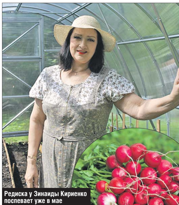
Редиска у Зинаиды Кириенко поспеет уже в мае

— Когда-то мой супруг и дети жили в Подмосковье постоянно, я же больше времени проводила в Москве: концерты, творческие встречи... Сейчас это тоже есть, я работаю, но много времени посвящаю и растениям, — говорит актриса. — Мы с мужем оба с юга и, когда появился участок, просто обожали