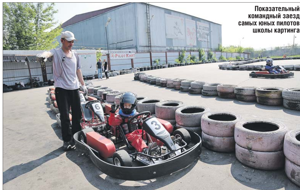
Показательный командный заезд самых юных пилотов школы картинга