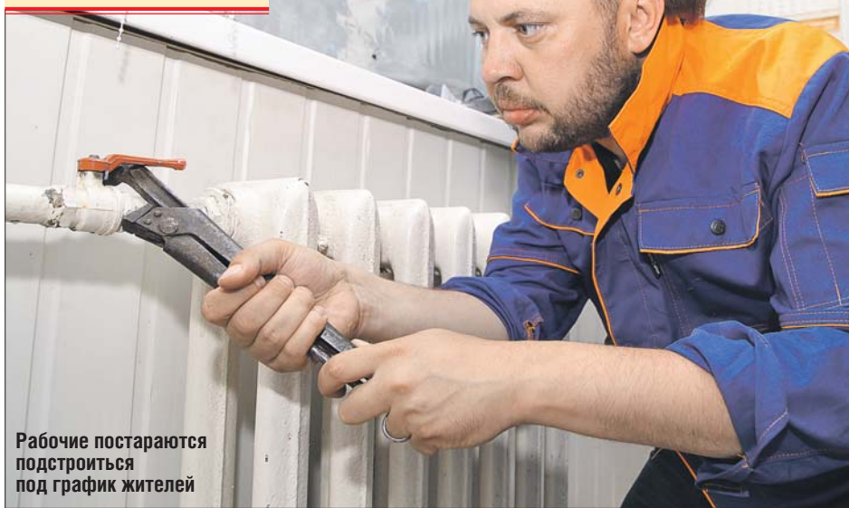
Рабочие постараются подстроиться под график жителей

Монтаж новых батарей может занять два дня