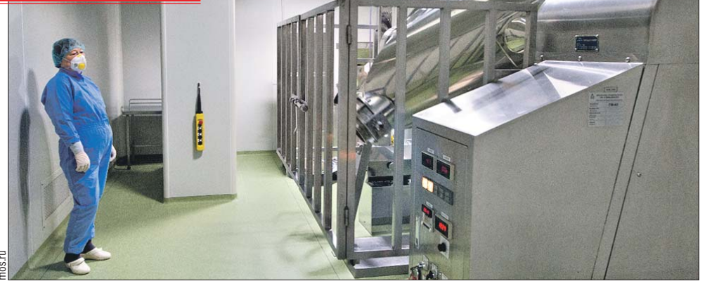
На заводе производят лекарства для лечения ВИЧ-инфекции, рака, кардиологических заболеваний