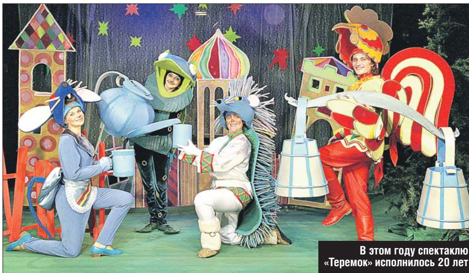
В этом году спектаклю «Теремок» исполнилось 20 лет

Музыкальный театр Геннадия Чихачёва на 1-й Новокузнецкой готовит премьеры