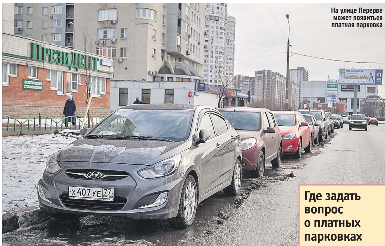
На улице Перерве может появиться платная парковка

На момент встречи на территории района Ма-