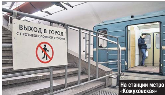
На станции метро «Кожуховская»

Ремонт эскалаторного павильона станции метро «Кожуховская» продлится до 21 декабря . Об этом сообщили в пресс-службе Московского метрополитена. На работе самой станции это не отразится: «Кожуховская» — станция мелкого заложения, находится на глубине всего 12 метров, и, помимо эскалатора, здесь имеется лестница.