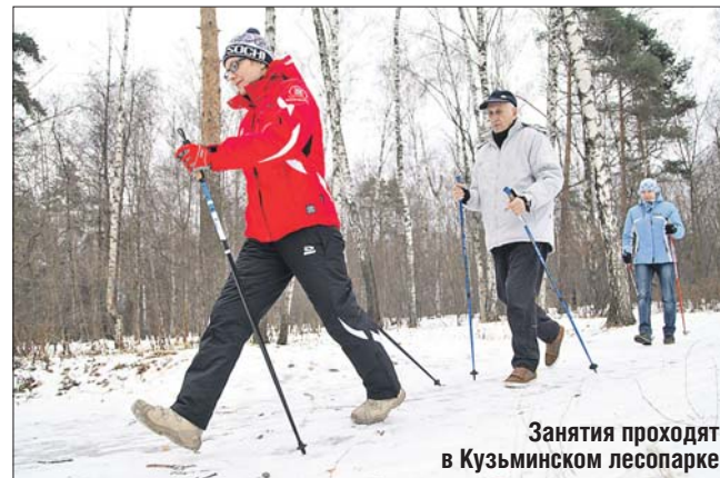
Занятия проходят в Кузьминском лесопарке

В ЮВАО начала работу бесплатная секция скандинавской ходьбы. Занятия будут проходить в Кузьминском лесопарке на базе пункта выдачи спортивного инвентаря (ул. Заречье, вл. 7). Для удобства занимающихся предусмотрены тёплые раздевалки.