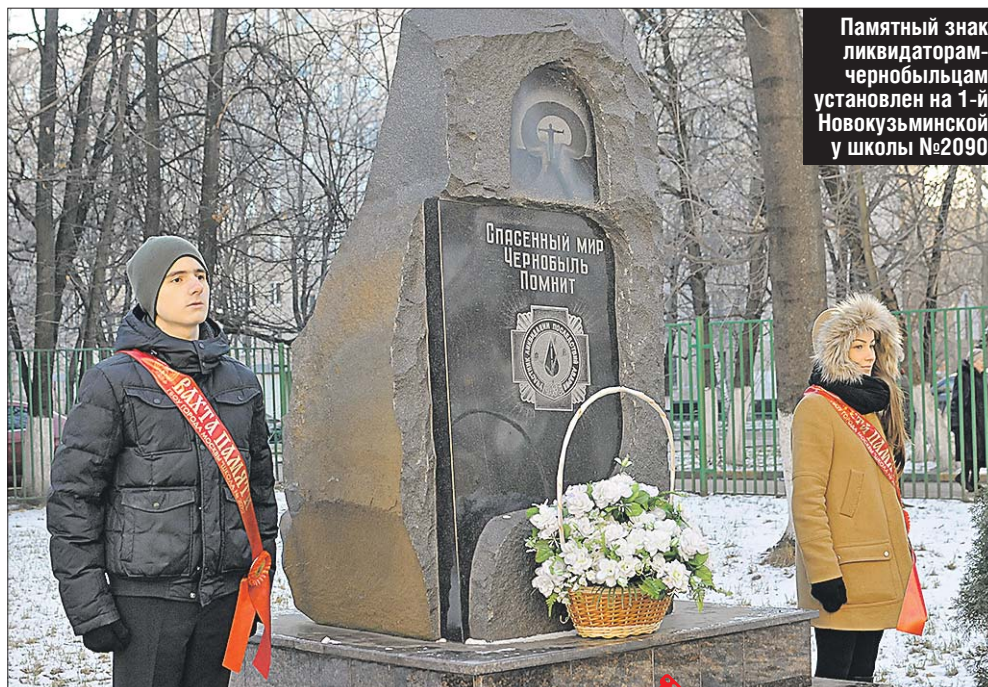
Памятный знак ликвидаторам-чернобыльцам установлен на 1-й Новокузминской у школы №2090