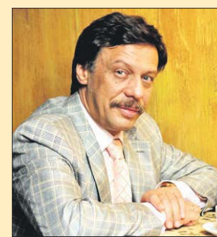
Михаил Барщевский проверил результат голосования

Процедура проверки максимально удобна. Для этого пользователю необходимо зайти на сайт ag.mos.ru под своим логином и паролем (сделать это можно как с персонального компьютера, так и со смартфона; в мобильном приложении функция проверки пока недоступна), найти и открыть