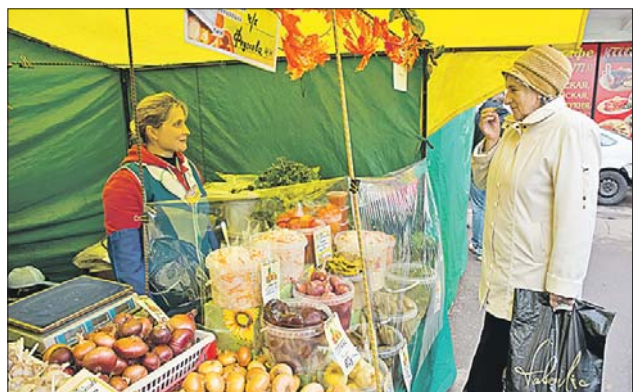
В этом году в ЮВАО работали 14 ярмарок

Напомним: в этом году с апреля по декабрь на