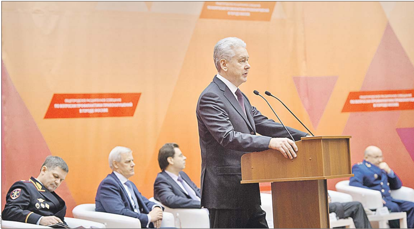
Сергей Собянин попросил полицейских сосредоточить усилия на борьбе с карманными кражами