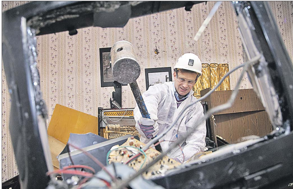
Корреспондент «ЮВК» крушит «терапевтической кувалдой» старый телевизор

Проект под названием «Дебош» появился в столице около месяца назад. Его авторы, молодые ребята, предлагают посетителям выплеснуть накопившиеся эмоции с помощью кувалды или бейсбольной биты. В объявлении так и пишут: «Если ты очень близок к тому, чтобы сорваться и начать крушить всё на своём пути, то тебе к нам». Место для снятия стресса — старые склады заброшенного АЗЛК, неподалёку от Волгоградского проспекта. Цена вопроса — от 10 до 30 тыс. рублей. За эти деньги ребята предлагают взять кувалду или биты, войти в заранее подготовленную жилую комнату и всё там разнести в щепки. И желающие находятся.