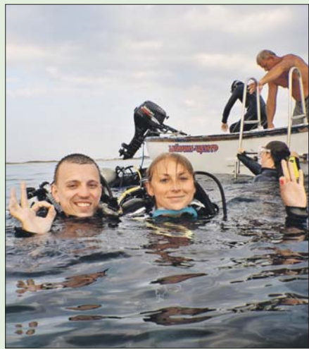
«Погружение на затопленный танкер «Валериан Куйбышев» времён Великой Отечественной войны. Бугазская коса».

Победители будут названы в следующем номере. Их ждут ценные призы: 1-й приз — фотоаппарат, 2-й — планшет, 3-й — смартфон.