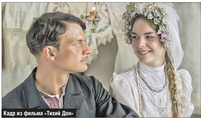
Кадр из фильма «Тихий Дон»

Беседовала Марина Долгорукая