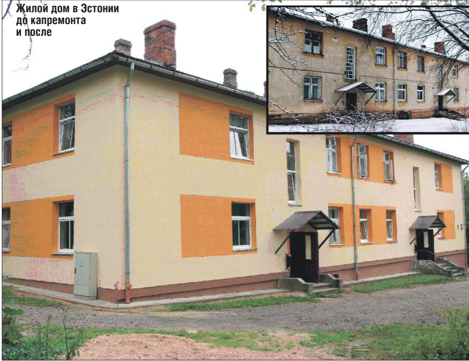
Жилой дом в Эстонии до капремонта и после

За состоянием дома в Эстонии обязаны следить собственники квартир