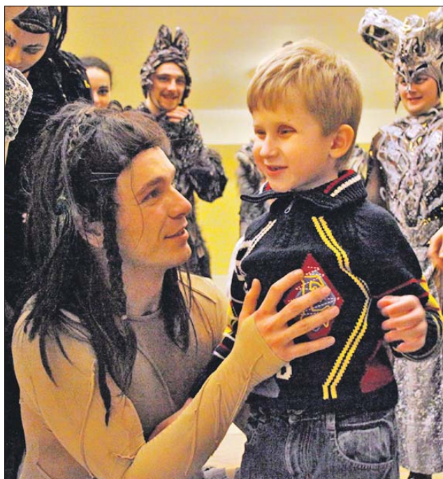
Актёры театра с юным зрителем