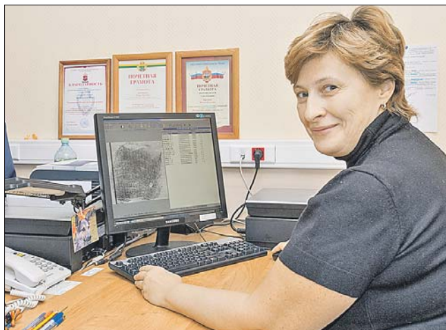
«Пальчики» с места преступления сканируют и заносят в базу

В ЭКЦ по ЮВАО работают 107 экспертов, которые производят 12 видов экспертизы. О дактилоскопии слышали даже далёкие от криминалистики люди. Мне на палец с помощью валика наносят чёрную краску и оставляют след на специальном бланке — дактилоскопической карте. После чего делают неожиданное предложение: