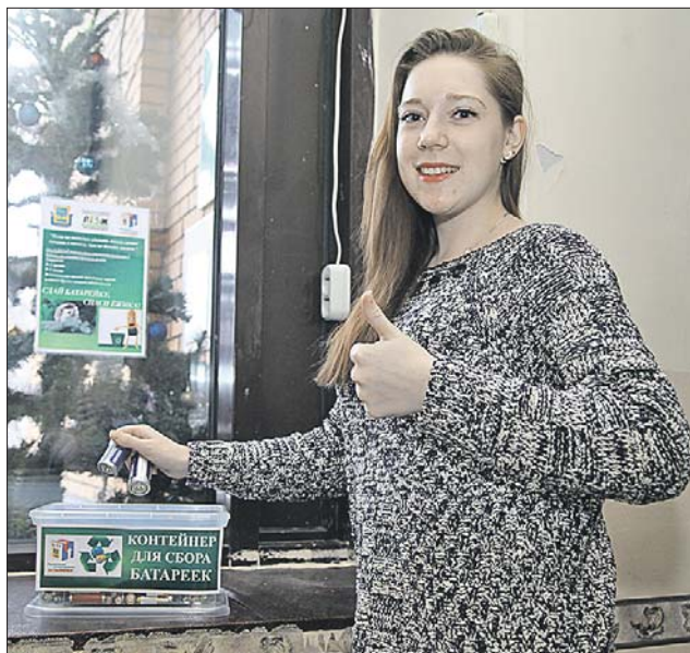
Собранные батарейки направят на специализированное предприятие для переработки