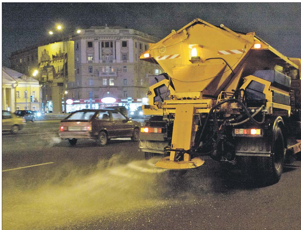
Проезжую часть обрабатывают реагентами с хлоридами натрия и кальция

По регламенту во время снегопадов в первую очередь коммунальщики должны расчищать и обрабатывать реагентами выходы из подъездов, подходы к остановкам общественного транспорта, входы на станции метро. В настоящее время на улицах и тротуарах Москвы разрешено применять три вида реагентов. В состав комбинированного реагента, который применяют