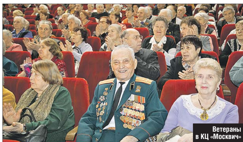
Ветераны в КЦ «Москвич»