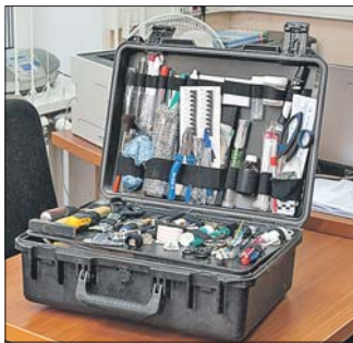
Чемодан криминалиста очень тяжёлый

В экспертно-криминалистическом центре (ЭКЦ) на Волжском бульваре с утра до вечера — экспертизы: исследуют вещества на наличие наркотиков, определяют, из какого оружия стрелял преступник, сравнивают отпечатки пальцев и т.д. Корреспондент «ЮВК» провела целый день бок о бок с криминалистами.