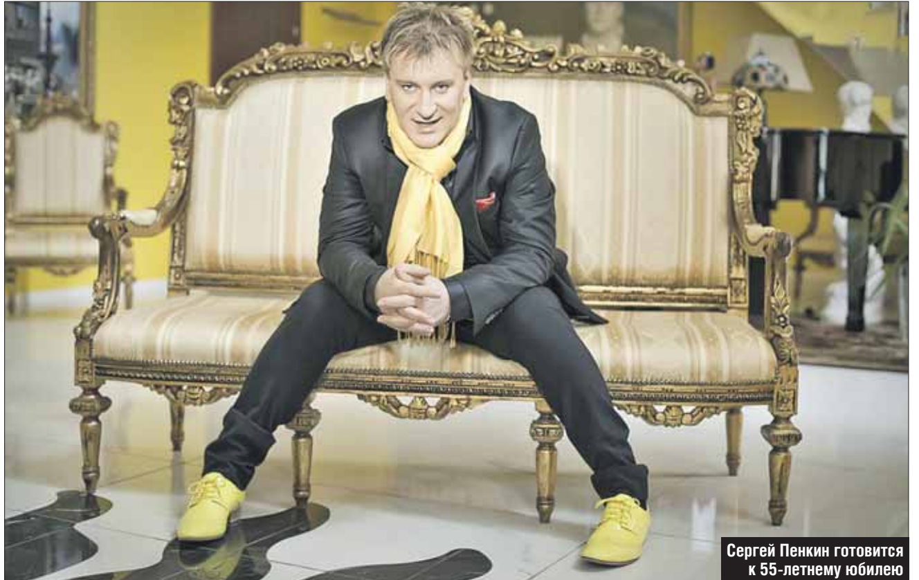
Сергей Пенкин готовится к 55-летию юбилею

— Знаю, что вы служили в армии. А в каких войсках?