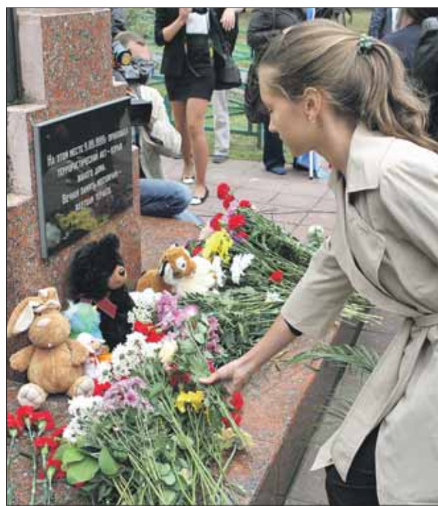
Возложение цветов к мемориалу в память о погибших на улице Гурьянова