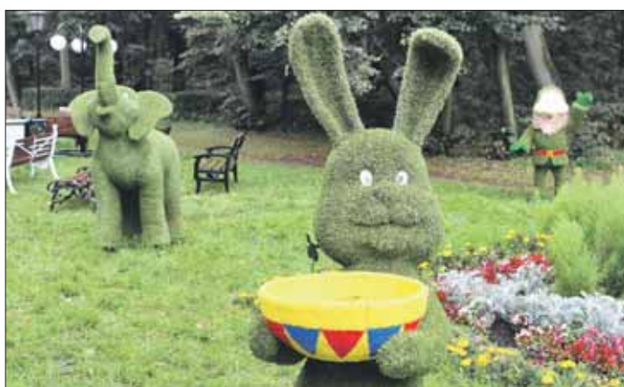
На фестивале цветников были представлены новинки топиарного искусства