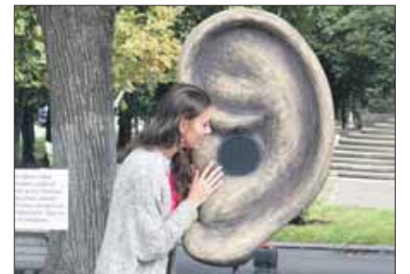
На ухо можно шепнуть о проблемах, возникших при оформлении документов

На ВДНХ прошёл масштабный праздник в честь четырёхлетия центров госуслуг «Мои документы». На главной выставке была установлена необычная инсталляция — «Ухо» центров госуслуг «Мои документы».