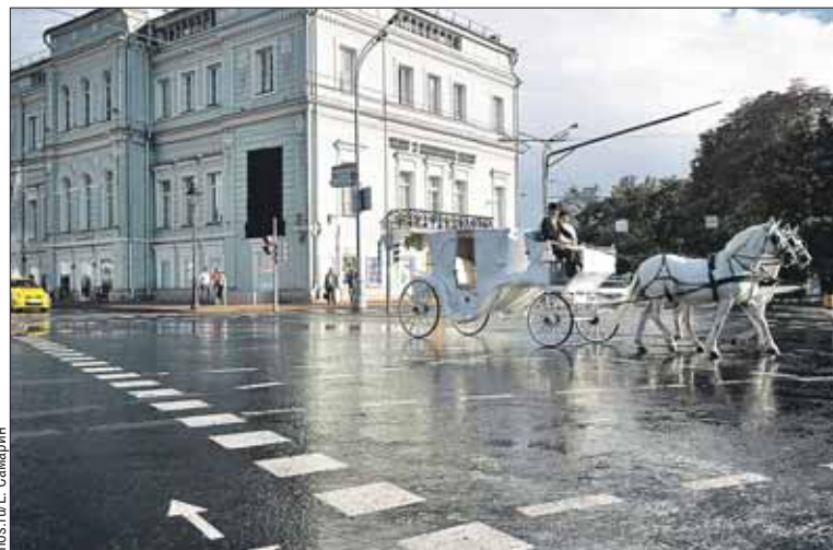
Большая Никитская после реконструкции