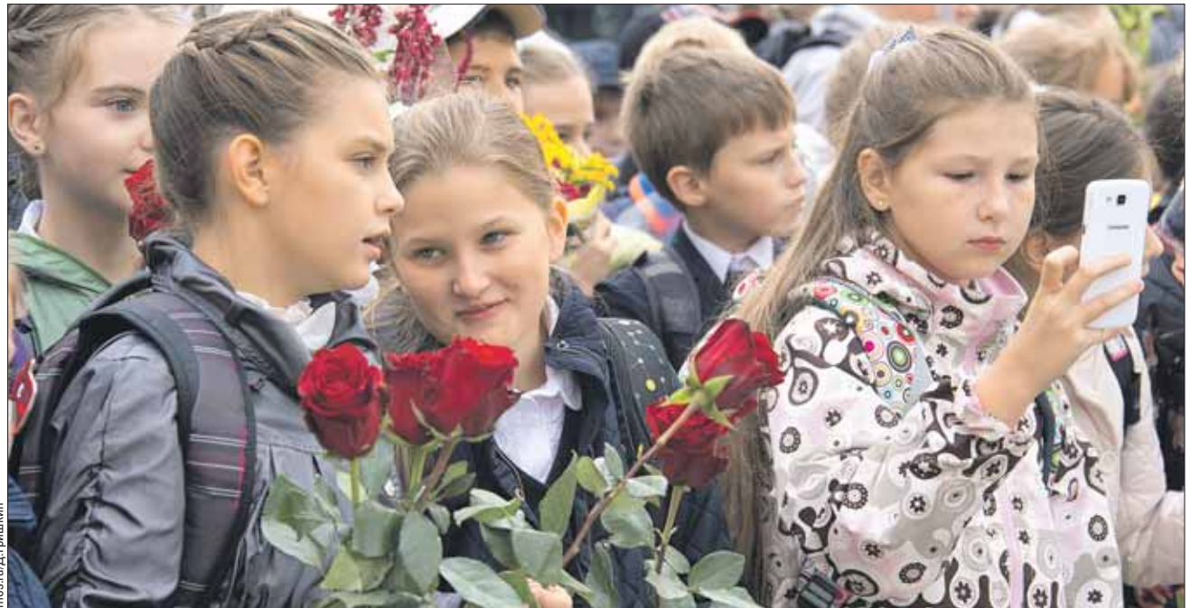
1 сентября в школе №830 на северо-западе столицы

По словам Собянина, около 80% родителей выбрали для первоклашек школы в своём микрорайоне.