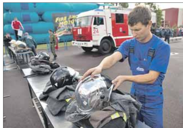
В финале состязались 10 команд — лучшие пожарные различных спецслужб