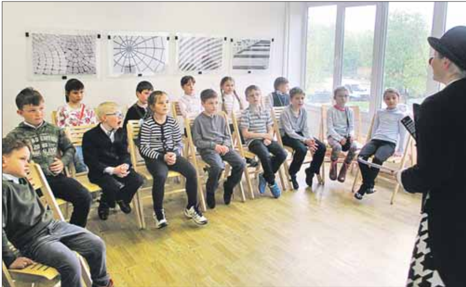
Гостей арт-клуба «Печатники» встречают аниматоры

В арт-клубе будет несколько площадок. В киноклубе можно будет посмотреть современные картины, уже ставшие культовыми, а потом за чашкой кофе их обсудить. На игровой площадке станут собираться любители настольных игр: от шахмат до «Мафии». В творческой дизайнерской мастерской специалисты будут делиться своими идеями с гостями, например дадут советы по дизайну квартир. На «территории общения» и в «бизнес-руме» гости, включив Wi-Fi, смогут проводить онлайн-