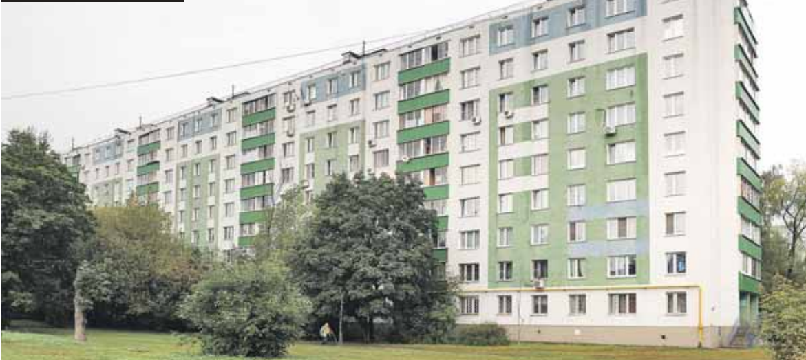
Дом 10, корпус 3, на Ферганском проезде

В доме 10, корп. 3, на Ферганском проезде замену стояков холодной и горячей воды первоначально запланировали на 2020–2021 годы, а разводящих магистралей в подвале — только на 2041–2042-й. Работы в подъездах были запланированы на 15 лет: 2027–2029-й — лифты, 2030–2032-й — мусоропроводы, 2042–2044-й — электропроводка. В период посередине — 2033–2035 годы — запланирован ремонт канализации. Ну и по мелочам: замена газо-