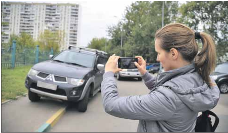
С октября можно будет сообщать об автомобилях, припаркованных там, где это запрещено

Теперь можно сообщать об автомобилистах, нарушающих правила парковки, куда следует