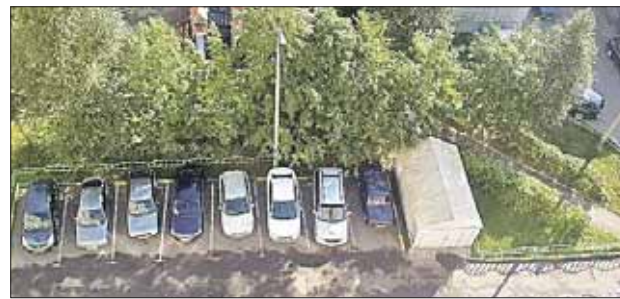
Незаконный гараж на Братиславской

Житель дома 24 на Братиславской улице написал: «В 2012 году был произведён снос «ракушек» и гаражей, незаконно установленных на территории около подъезда. Но один из гаражей каким-то чудом избежал этой участи. Он занимает два парковочных места и портит не только общий облик двора, но и представля-