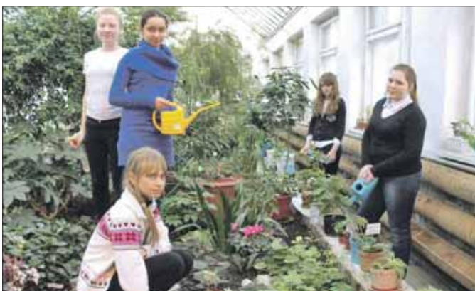
Занятия в кружке будут проходить по вторникам

Записаться в кружок «Ботаника» можно по телефону (499) 377-3593