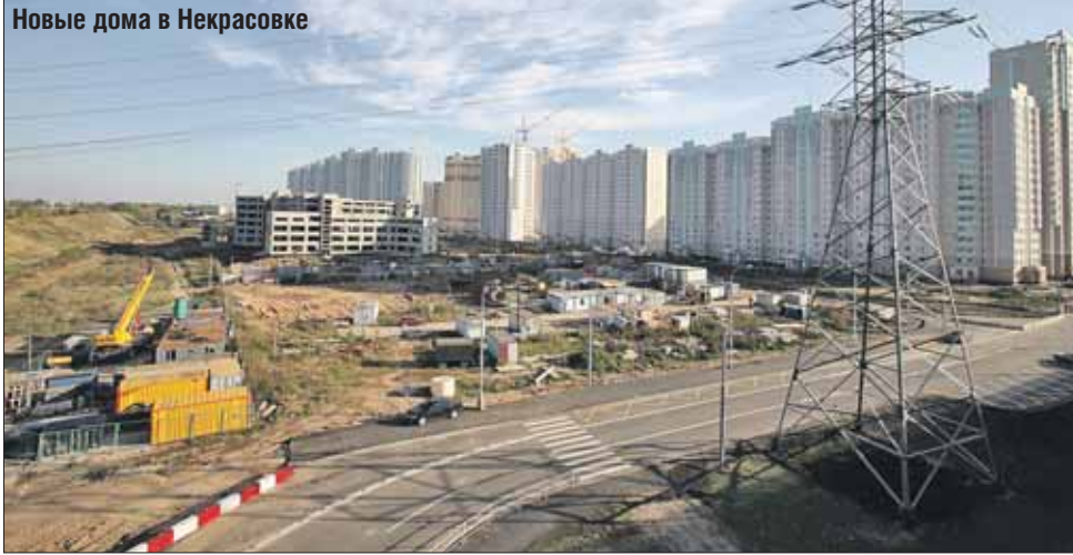
Новые дома в Некрасовке

Юго-Восток по-прежнему остаётся главной строительной площадкой столицы. В этом году здесь построят свыше 220 тыс. кв.