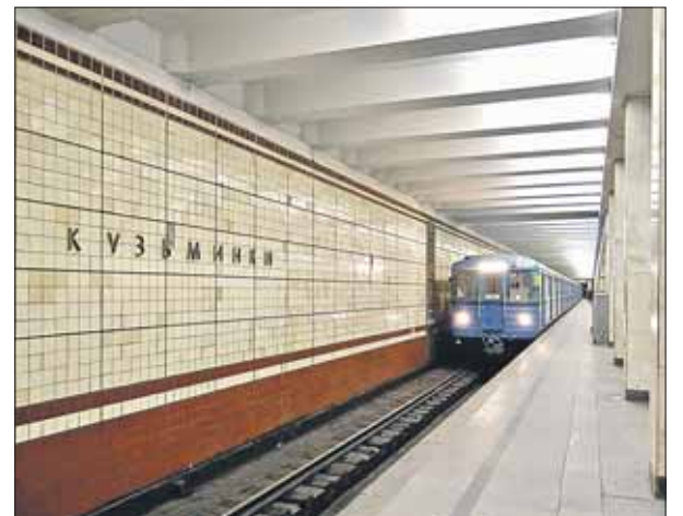
Благодаря ночному проветриванию температура в метро снизилась

На станции метро «Кузьминки» и ещё на 10 станциях московской подземки провели эксперимент: входные двери в метро открыли на ночь, чтобы понизить температуру в вестибюлях и на станциях.