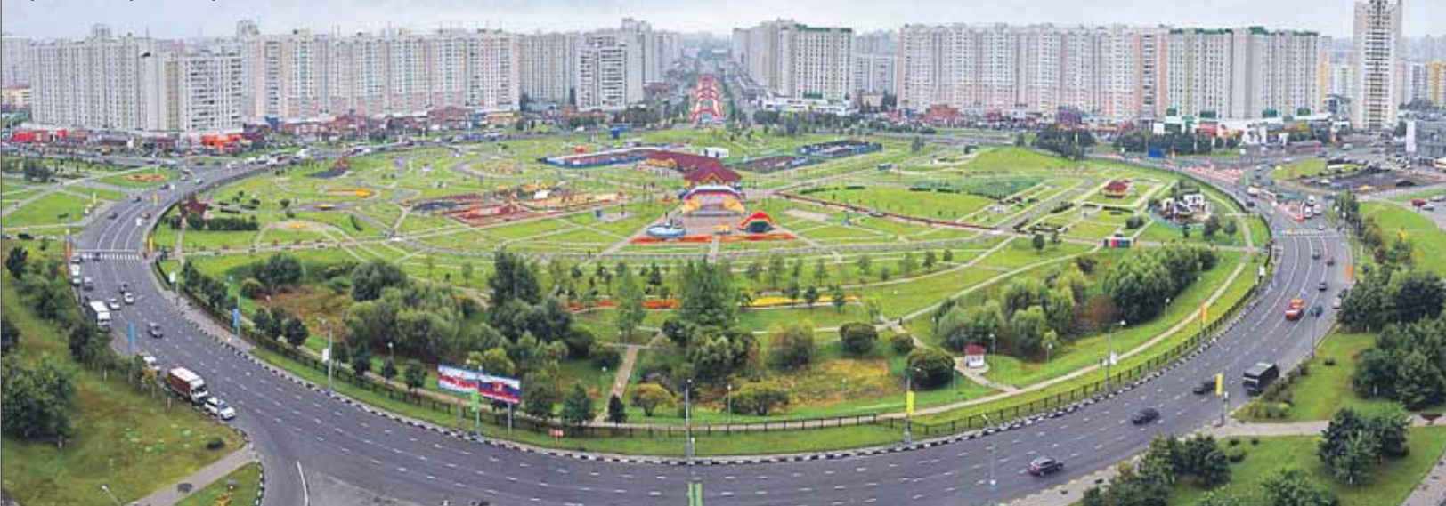
Парк имени Артёма Боровика