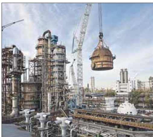
Общественность хочет следить за датчиками завода в режиме реального времени

Общественная палата РФ обратилась в Федеральную службу по надзору в сфере природопользования и экологии и в Роспотребнадзор с просьбой провести проверку Московского нефтеперерабатывающего завода (МНПЗ) в Капотне на предмет соблюдения природоохранного законодательства, а также в кратчайшие сроки обеспечить передачу информации с датчиков предприятия на сервер Общественной палаты в режиме реального времени. Об этом сообщили в пресс-службе этой организации.