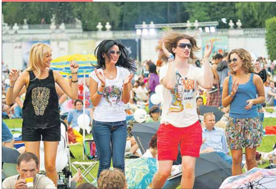
Для любителей клубных танцев тренеры проведут мастер-класс

участие смогут все желающие старше 12 лет, для этого необходимо иметь свой велосипед, скейтборд или ролики. В перерывах между отборочными этапами конкурса зрители смогут посмотреть концерт и показательные выступления спортсменов. Начало в 17.00. Для участия необходимо зарегистрироваться по телефону (495) 355-1774 .