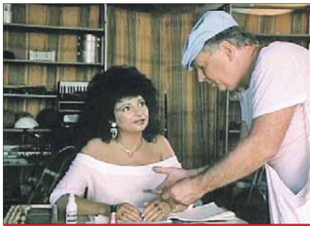
Кадр из фильма «Новый Одеон»

— С чего началась любовь к братьям меньшим?