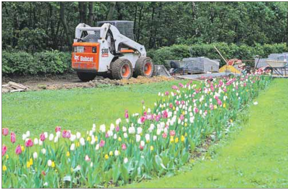
Работы в парке «Кузьминки» планируют завершить к середине лета

Для любителей шашек и шахмат, которые собираются по вечерам в парке, сделают удобный крытый павильон с лавочками и специальными столами. Также здесь обустроят новый павильон проката спортив-