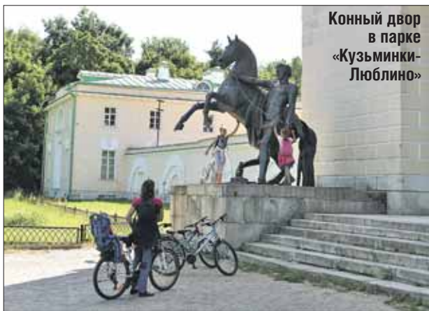
Конный двор в парке «Кузьминки-Люблино»

Так называют одну из главных достопримечательностей нашего округа — дворцово-парковый ансамбль «Лефортово». В первую очередь здесь стоит увидеть дворец, построенный в конце XVIII века для императрицы Екатерины Великой (1-й Краснокурсантский пр., 3/5). Впоследствии внушительное здание с колоннадой превратили в военное училище. Миновав его, можно проехать или пройти к храму Петра и Павла (ул. Солдатская, 4). Церковь в честь небесных покровителей первого российского императора начал строить его сподвижник генерал Франц Лефорт. По преданию, в закладке