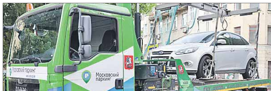
Вернуть деньги за неправильную эвакуацию теперь можно без решения суда