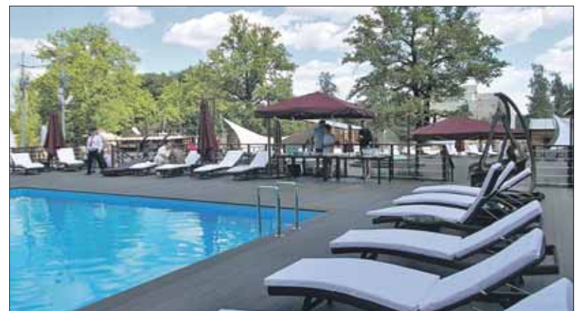
Новая зона отдыха появилась в южной части ВДНХ