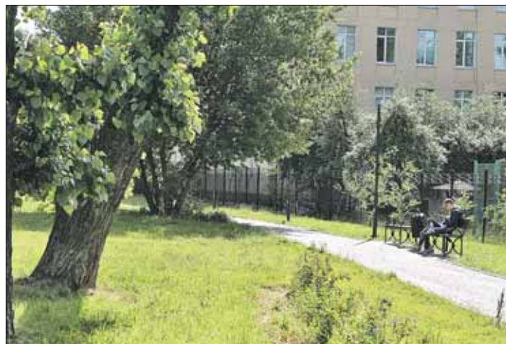
Парк «Карачарово» на Перовском шоссе