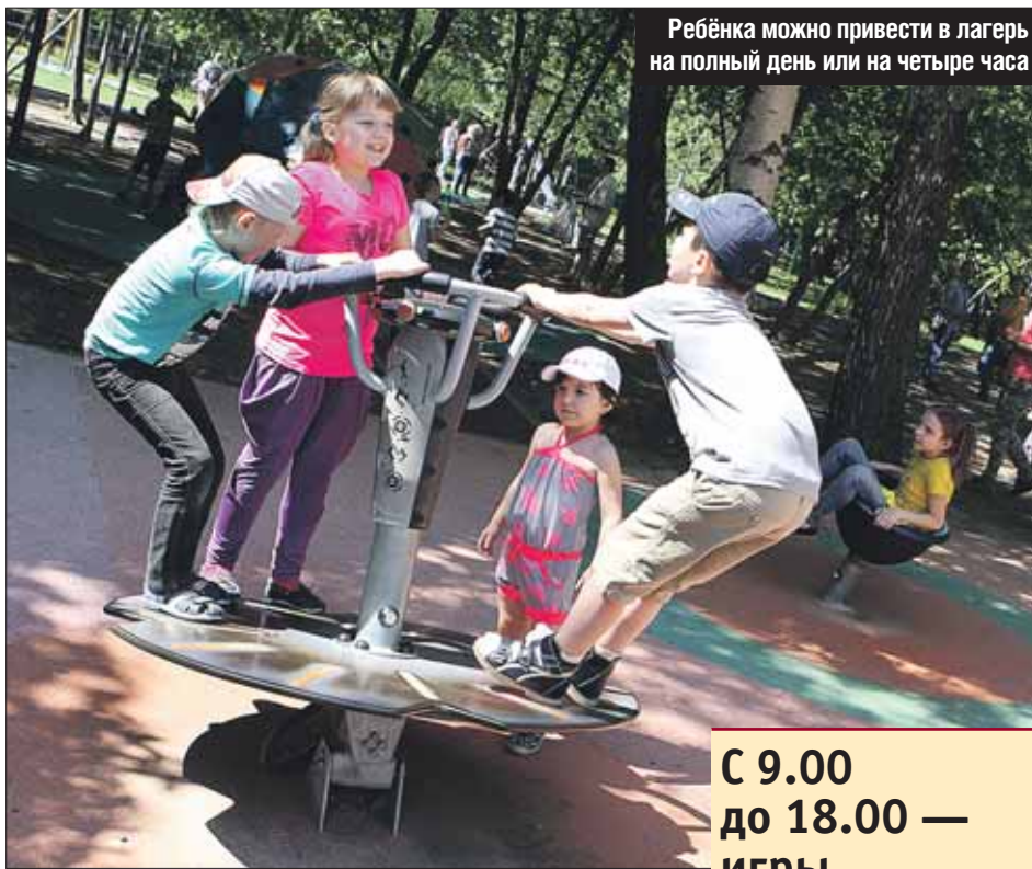
Ребёнка можно привести в лагерь на полный день или на четыре часа

В ТЦСО «Жулебино», например, делают упор на экскурсии.