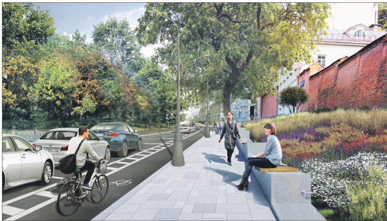
На Рождественском бульваре появятся разноуровневые скамейки