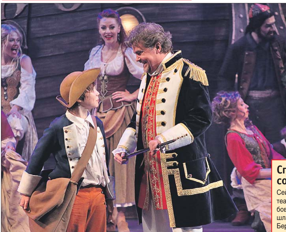
Спектакль «Остров сокровищ» могут «смотреть» слепые зрители