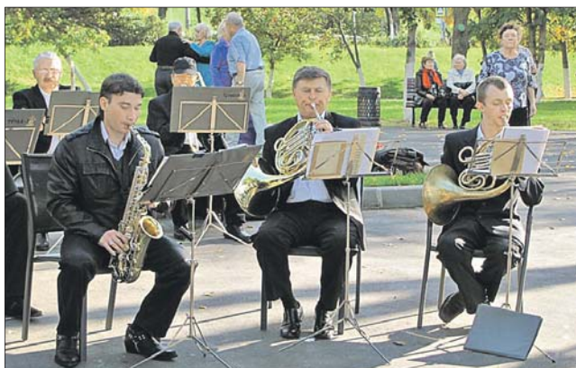
На одной площадке музыканты могут выступать не более трёх часов