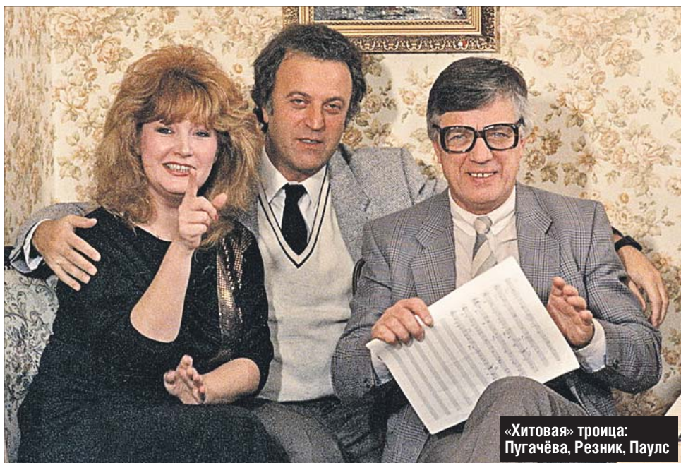
«Хитовая» троица: Пугачёва, Резник, Паулс