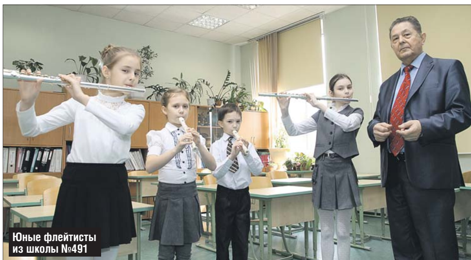
Юные флейтисты из школы №491

Большинство учеников медицинского класса гимназии №1359 на Лермонтовском проспекте хотят стать врачами, чтобы делать уникальные операции, помогать больным людям, вести научные исследования. Каждую неделю по пятницам они ездят на факультет довузовской подготовки 1-го Московского медицинского университета им. Сеченова на спецкурс «Шаг в медицину». Надев белые халаты, они учатся на муляжах и тренажерах делать искусственное дыхание и непрямой массаж сердца, промывать желудок и ставить клизму, обрабатывать раны и делать перевязки.