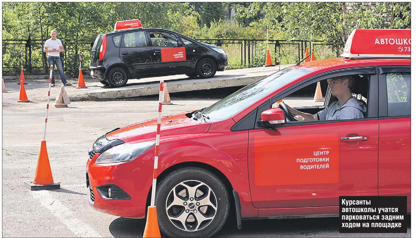
Курсанты автошколы учатся парковаться задним ходом на площадке

Езду по городу по-прежнему будут оценивать в баллах: набрал 5 штрафных баллов и более — не сдал. Но раньше непристёгнутый ремень относился к числу мелких ошибок и давали за это 1 балл. Те-