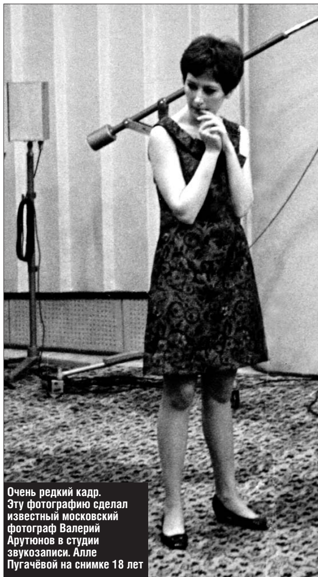
Очень редкий кадр. Эту фотографию сделал известный московский фотограф Валерий Арутюнов в студии звукозаписи. Алла Пугачёвой на снимке 18 лет

— Она — композитор, и это как-то не оценено: не многие знают, что она написала «Звёздное лето»,