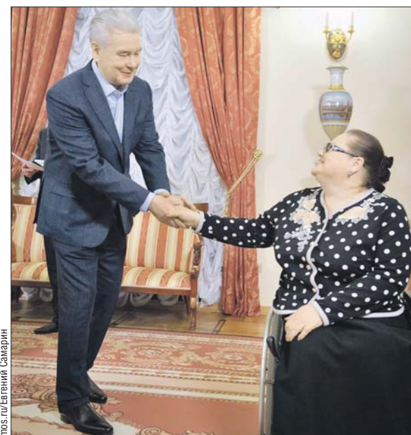
Сергей Собянин встретился с инвалидами Москвы