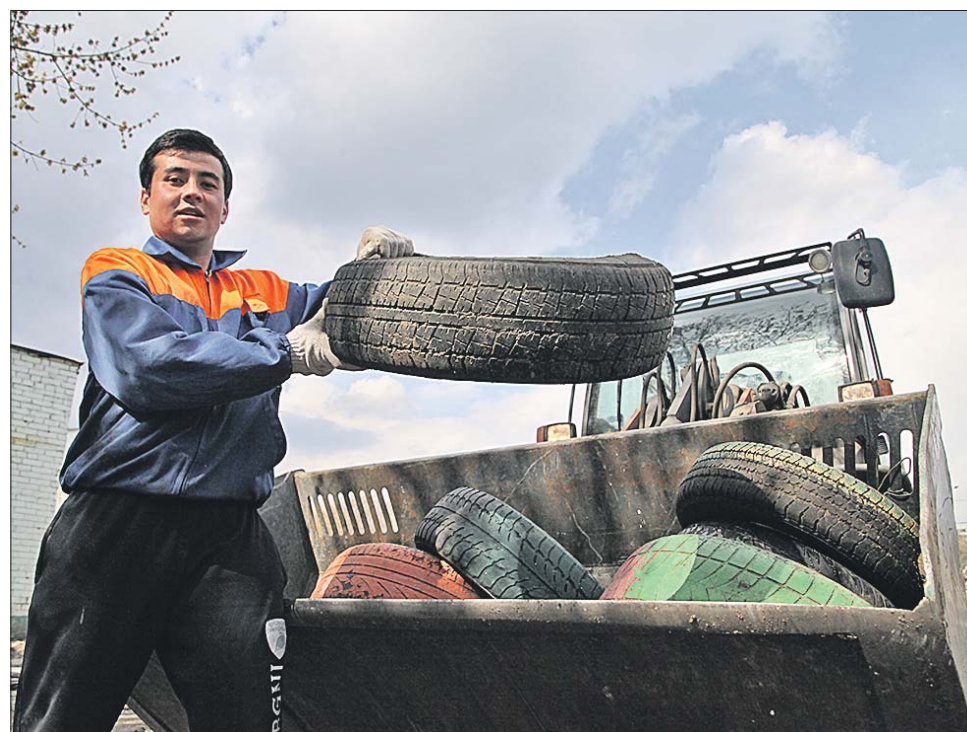
Покрышки можно сдать на Сормовской

— Сейчас, чтобы сдать колесо в утиль, нужно ещё и заплатить — минимум 100 рублей за одно колесо. По статистике, в год в Москве образуется 70 тысяч тонн отходов покрышек от автомобилей. Для сравнения: во всём Подмосковье — 50 тысяч, — говорит зам. директора перерабатывающей компании «Орис