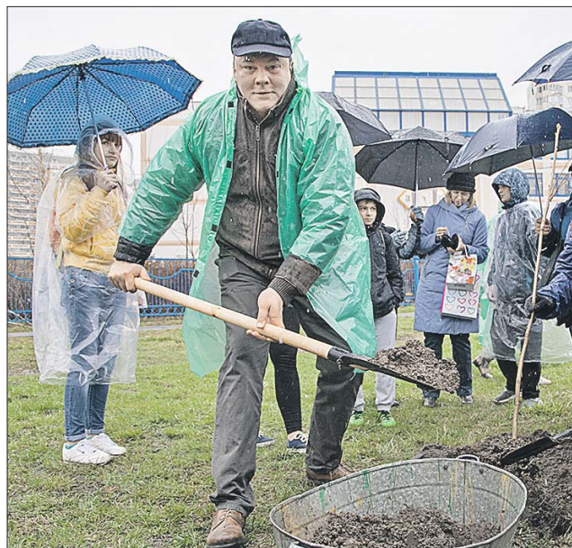
Пётр Толстой сажает маньчжурский орех на Новочеркасском бульваре

Жительниц Новочеркасского бульвара заслу-