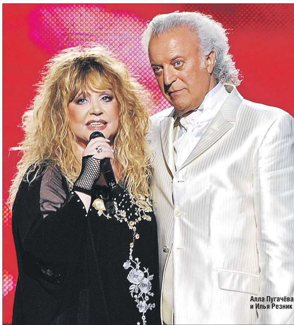
Алла Пугачёва и Илья Резник

— Я знаю Аллу с 1972 года, с песни «Посидим, попокаем». Начинать новую песню и думать: «Как бы Алла поступила в этой ситуации? Как бы она жила,