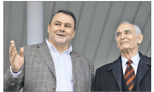
Пётр Толстой и Василий Лановой наблюдают за строевой подготовкой курсантов училища

возложены задачи охраны и обороны Кремля, обеспечения безопасности руководителей государства и правительства.