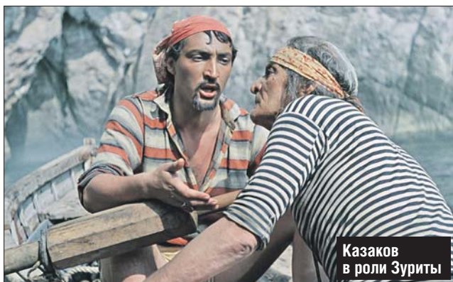
Козаков в роли Зуриты

— Все трюки в «Человеке-амфибии» Козаков исполнил сам. Например, полз по верёвочной лестнице на скале в 25 метрах над водой, — вспоминал оператор фильма Эдуард Розовский.